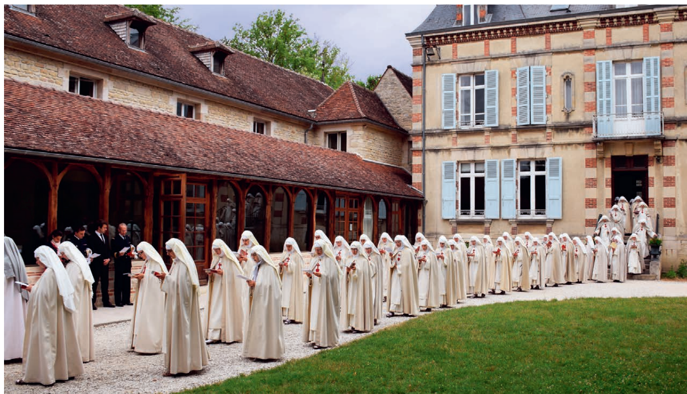
Processie van de zusters naar de kapel van het Maison Saint-Joseph voor het feest van het H. Hart, 21 juni 2020.