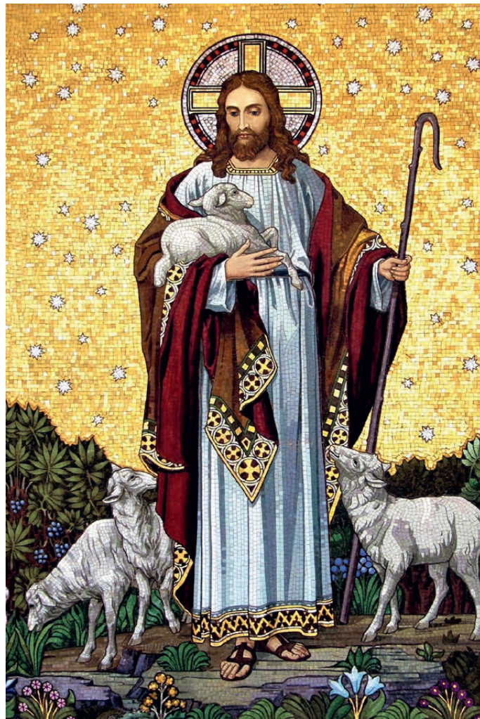
DE SCHONE HERDER. Stedelijk kerkhof van Kufstein (Oostenrijk), ca. 1850.

We zijn getuige van iets totaal nieuws: de geboorte van een gemeenschap die niet gebaseerd is op het ras of op een land, zelfs niet op de eredienst van Jahweh God in zijn Tempel, maar enkel en alleen op de Persoon van Jezus, de “schone herder” van de schapen. Jezus is tegelijkertijd de “deur” die toegang geeft tot de “binnenkoer” én de herder zelf. Zij die niet binnengaan door de deur zijn de Farizeeën en Wetgeleerden: zij oefenen een gezag uit dat ze zich onrechtmatig toeëigend hebben, als dieven en rovers. En de portier is Jahweh, de God van Mozes. Hij is het die opendoet voor de herder en die tegelijkertijd de schapen een instinctieve gehoorzaamheid vol liefde geeft, om te luisteren