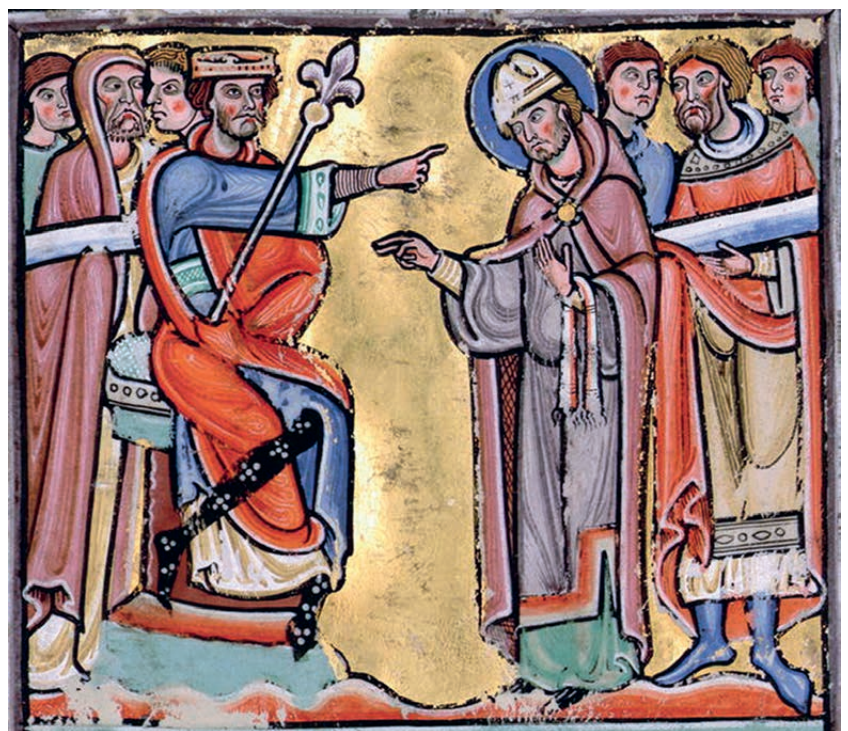
Amandus krijgt van de Merovingische koning Sigebert III de investituur voor de bisschopszetel van Maastricht. Uit hetzelfde manuscript 500.

Onder de bewonderaars van de bisschop moeten we natuurlijk de H. Bavo vermelden, die geboren werd in Haspengouw als de welgestelde edelman Alwin. Na een werelds leven kwam hij bij de dood van zijn echtgenote tot inkeer, sprak bij Amandus een generale biecht en werd, na een zware boetedoening, door de apostel als