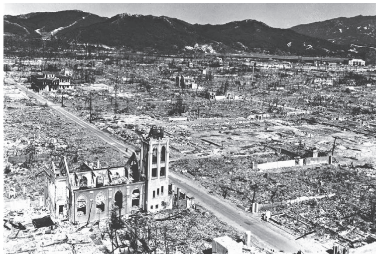
De verwoeste stad na de explosie.

Vooran het karkas van de kerk van Onze-Lieve-Vrouw Ten Hemel Opgenomen; op de achtergrond links de pastorie, die niet vernietigd werd en waarin de vier jezuïeten de atoombom overleefden.