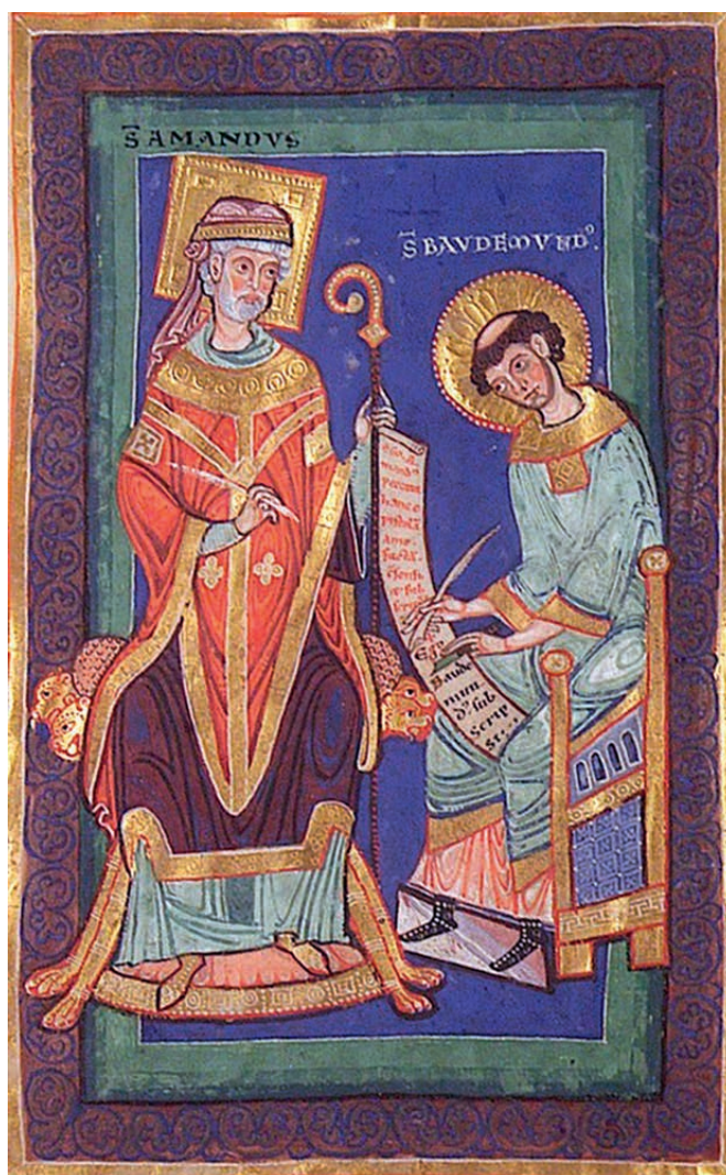
AMANDUS DICTEERT ZIJN TESTAMENT aan zijn trouwe medewerker en biograaf Baudemond. Miniatuur uit een 12 de -eeuws manuscript over het leven van de heilige (Valenciennes, stadsbibliotheek, ms. 500).

Ondanks al het wapengeweld kwam de kerstening van onze gewesten in de zevende eeuw plots in een stroomversnelling. De Eeuw van de heiligen brak aan: de periode van 625 tot 739,