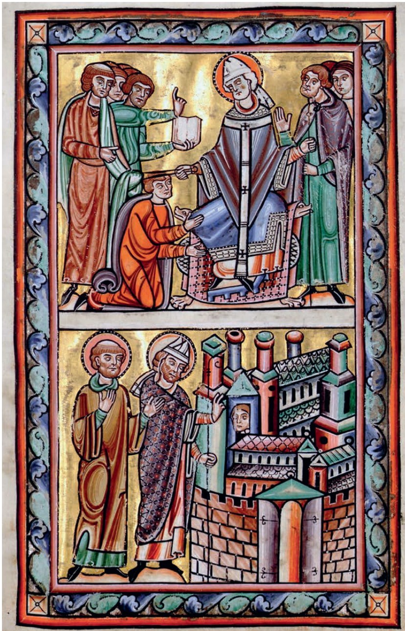
Twee miniatures uit manuscript 500 van de stadsbibliotheek in Valenciennes.

Gedurende de drie jaren van zijn episcopaat (647-650) bezocht Amandus « alle steden en voorname plaatsen » van zijn bisdom en verkondigde overal de Blijde Boodschap. Heel de bisschoppelijke hofhouding nam deel aan deze reizen, die plaatsvonden per boot of te paard. « Evangelies en andere gewijde boeken werden