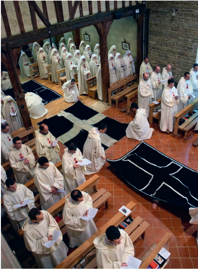
Eeuwige geloften van drie Kleine broeders van het H. Hart. «Ik wil sterven voor de wereld om verzezen te leven met Christus.»

verklaringen van de Kerk en anderzijds de feitelijke ongelijke deelname van de vrouwen in het leven van de Kerk »... « In de perceptie van het grote publiek en zelfs in de schoot van de Kerk stelt men een belangrijk verschil vast tussen de verklaringen van theologen over de mogelijkheid om ook vrouwen te roepen tot de ambten van de Kerk en daartegenover de manier waarop het leergezag van de Kerk met die kennis omgaat »... « Het theologisch onderzoek is in tegenspraak met de apostolische brief Ordinatio sacerdotalis van Joannes-Paulus II, waarin de uitsluiting van vrouwen van het sacramenteel ambt wordt voorgesteld als een definitieve beslissing. In dit verband moet de fundamentele thematiek van het evolueren van de dogma's in overweging genomen worden »... « Wat men moet motiveren is niet de toelating van vrouwen tot het gewijde sacramenteel ambt, maar wel het feit dat zij ervan uitgesloten worden. »