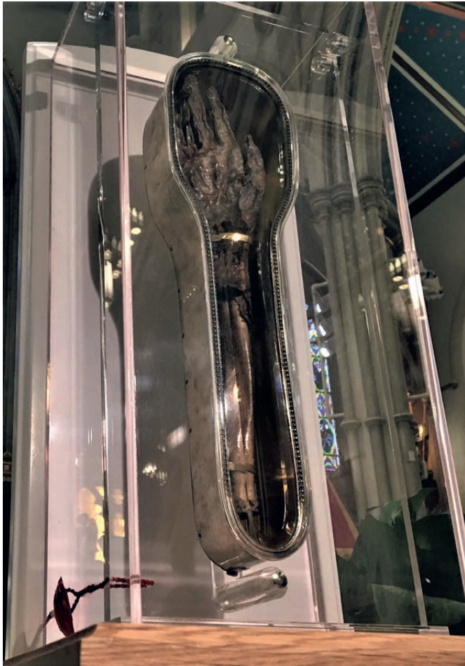
In de Gesù in Rome bewaart men een kostbare relikwie : de voorarm en hand waarmee de apostel van het Verre Oosten volgens de overlevering meer dan 700.000 heidenen gedoopt heeft. Op deze foto is de relikwie tentoongesteld in de kathedraal van Toronto in 2018.

bijeen gebedeld had. Daarna deed hij een ronde door de stad met in zijn hand een bel om de ouders met luide stem op te roepen dat ze hun kinderen en hun slaven naar de catechismusles moesten sturen. Die werkwijze was zo nieuw dat de kinderen hem volgden met een geestdrift die hun ouders beschaamd deed staan. Op enkele maanden tijd schonk hij Goa zo een religieuze praktijk en een vurigheid die van de stadstaat een bolwerk van de christenheid in het heidense India maakten.