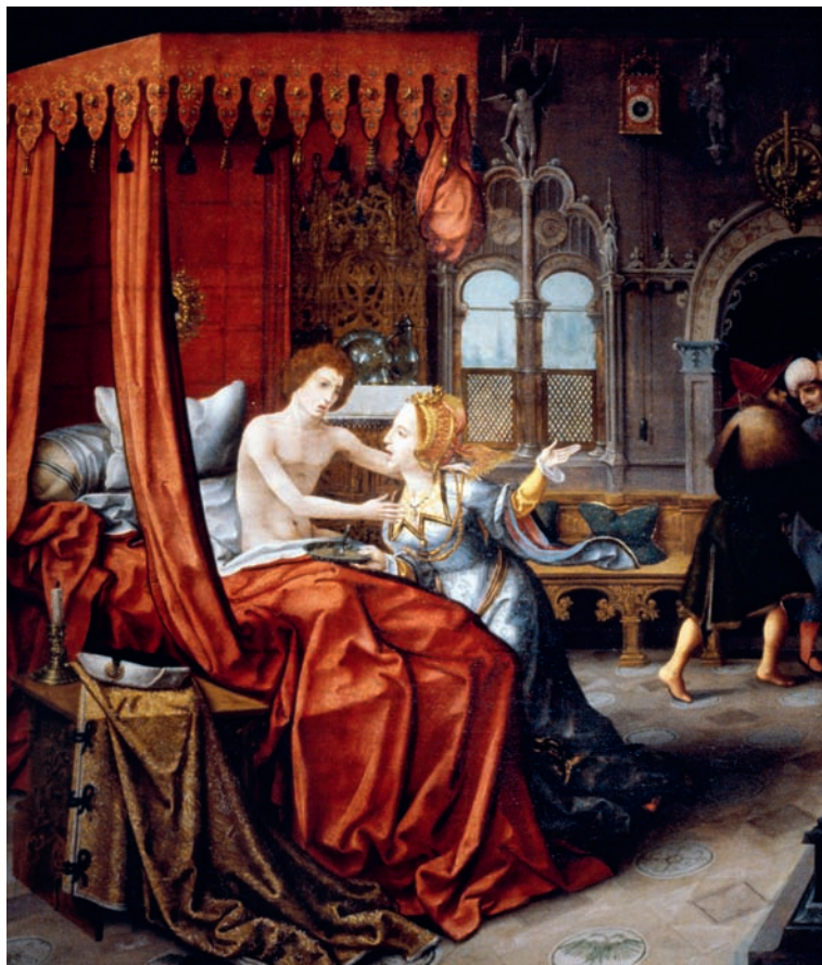
AMNON OVERWELDIGT TAMAR.

Wat was de hoogmoed van Eva, de hoogmoed van de eerste zonde? Ze werd verleid door de slang, de duivel, en was geflatteerd van hem te vernemen dat zij kon uitbreken uit de toestand die God voor haar voorzien had. Ik zie die eerste vrouw, voortgekomen uit de handen van de Schepper in een staat van natuurlijke volmaaktheid. Ik zie hoe zij dialogueert met de slang, die intelligente ogen heeft