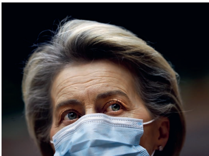
Ursula von der Leyen, onze niet verkozen "baas".