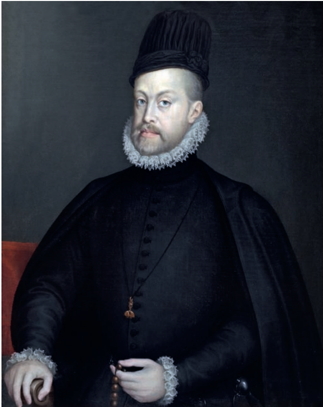
Koning Filips II geschilderd door Sofonisba Anguissola, een Italiaanse portretschilderes en een van de weinige vrouwelijke figuren in de kunstgeschiedenis.

de Habsburgers in wat zij van oudsher als een onvervreemdbaar deel van het Heilig Roomse Rijk beschouwden. Uiteraard was het alweer Alva die uitgestuurd werd, met de functie van kapitein-generaal, gouverneur van Milaan en onderkoning van Napels. De Venetiaanse ambassadeur in Londen merkte op dat daarmee aan de grote hertog « een gezag werd verleend zoals er wellicht nog nooit aan een minister of prins toegekend was ; hij kreeg de absolute macht alsof hij de koning in persoon was. »