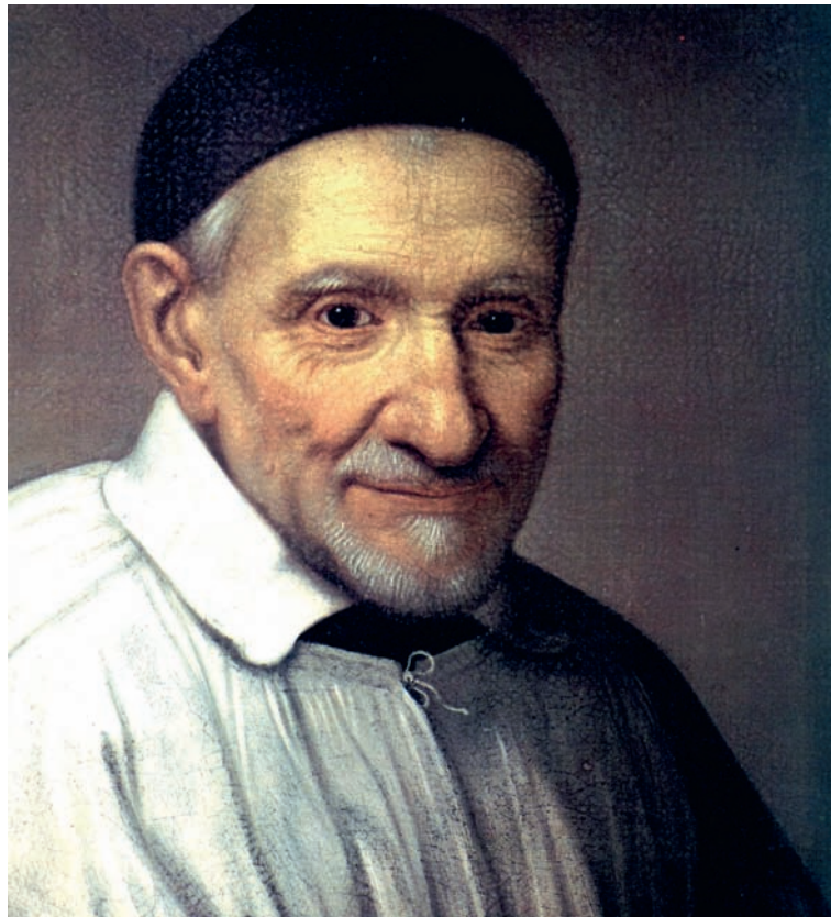
DE H. VINCENTIUS A PAULO (1581-1660).

De deugd van een man wordt gemeten aan het respect dat hij heeft voor een vrouw die zich aan