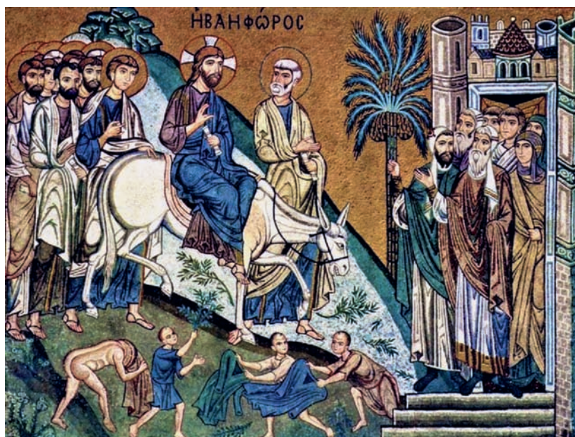
«Zie, uw Koning komt naar u toe, nederig, op een ezel gezeten, op een veulen, het jong van een ezelin» (Za 9, 9).

De bewuste Grieken zijn gekomen voor de feesten. Ze zullen dus getuigen zijn van de gebeurtenissen van Goede Vrijdag en Pasen en ze zullen pas weer vertrekken na de