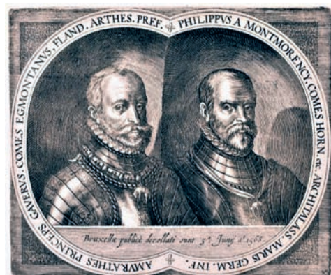
De graven van Egmont en Hoorn, terechtgesteld wegens landverraad op bevel van Alva.

Rond die tijd begon de toestand in de Nederlanden serieuze zorgen te baren. De machtige steden, Antwerpen op kop, hingen een godsdienstig liberalisme aan omdat de handel daar wel bij voer. De hoge adel – Oranje, Egmont, Hoorn – wou geen bemoeienis van Spanje met hun interne zaken. Doorn in het oog was kardinaal Granvelle, de invloedrijke raadgever van de landvoogdes, Margaretha van Parma : hij pleitte voor een steviger aanpak van de calvinisten en voor de loyale toepassing van de koninklijke politiek. Uiteindelijk stelden de Nederlandse edelen een ultimatum aan Filips II door het ontslag van Granvelle te eisen.