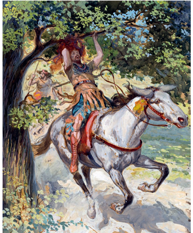
HET EINDE VAN ABSALOM door James Tissot (1899)

Daar komt nog bij dat iedereen niet alleen vindt dat zijn eigen grillen wet zijn, maar dat zij ook voor de anderen de wet uitmaken. Wat ziet men als men naar Parijs reist? Een stad die vol gekladderd is met graffiti. Het is voor sommigen een monsterachtige gewoonte geworden om alles te beschilderen met kabbalistische tekeningen die