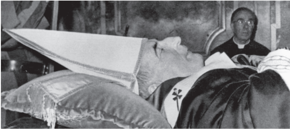
Het opgebaarde lichaam van de paus in de Sala Clementina.

De eerste dag trokken een kwart miljoen mensen langs het stoffelijk overschot. Sommigen riepen uit : « Wie heeft je dit aangedaan ? Wie heeft je vermoord ? »