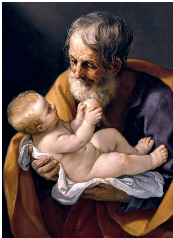
« HET HART VAN EEN VADER » : een aangrijpend schilderij uit 1640 door Guido Reni.

In Nazareth is Jezus gedurende dertig jaar gehoorzaam geweest aan zijn vader en moeder, aan hem die Hij in het dagelijks leven zijn “papa” noemde en aan zijn “mama”. De Zoon van God, de Schepper van het heelal, heeft onderdanig willen zijn aan de Maagd Maria en aan Sint-Jozef. Onze-Lieve-Vrouw, de Onbevleete Ontvangenis, het meest volmaakte schepsel ooit, heeft heel haar leven onderdanig willen zijn aan Sint-Jozef, uit gehoorzaamheid aan God, maar ook vanuit heel haar hart en heel haar liefde en met al haar nederigheid.