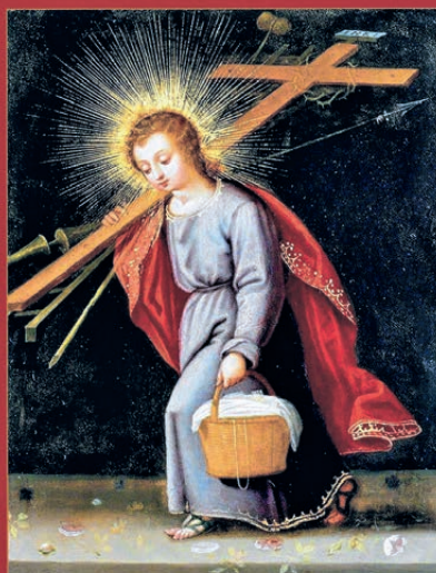
Het Kindje Jezus draagt de werktuigen van zijn Lijden