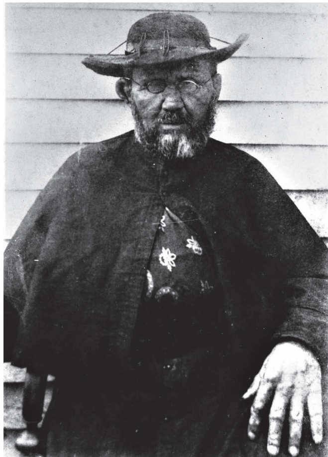
DE H. PATER DAMIAAN (1840-1889)

Het had God, het was in het paradijs, het vond in alles behagen. Het was er nauwelijks of helemaal niet mee bezig ongehoorzaam te zijn aan het bevel