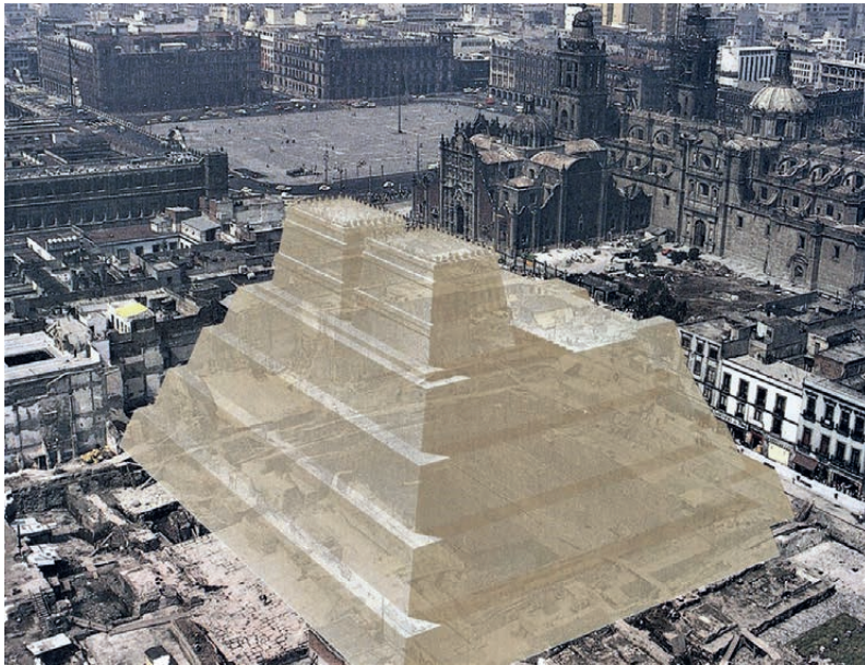
Projectie van de belangrijkste tempelpiramide van Tenochtitlan op het huidige centrum van Mexico-stad. Op wat de Spanjaarden de “Templo Mayor” noemden, bevonden zich twee heiligdommen : een voor de oorlogsgod Huitzilopochtli en een voor de regengod Tlaloc. Cortés liet de piramide, symbool van de dominantie van Satan over de Azteken, afbreken. De resten ervan kwamen tijdens verbouwingen in 1978 tevoorschijn, waarop de vrijmetselaarsregering van Mexico besloot om tot restauratie over te gaan « om de oorspronkelijke beschaving [?] van het land in ere te herstellen ». Men schat dat op de piramide jaarlijks minstens twintigduizend mannen, vrouwen en zelfs kinderen (zoals bewezen door recente vondsten) ritueel geslacht werden.