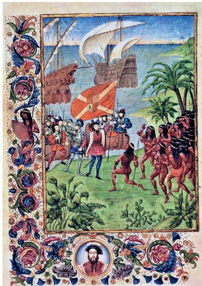
DE LANDING VAN CORTÉS IN MEXICO IN 1519. 16 de -eeuws manuscript bewaard in de British Library (Londen).

Waarom worden de conquistadores dan zo vaak in een slecht daglicht geplaatst? Dat komt door het protestantisme, dat precies in dezelfde tijdsperiode gestalte kreeg. Anders dan ons in de geschiedenis-handboeken wordt wijsgemaakt, betekenden de leer-