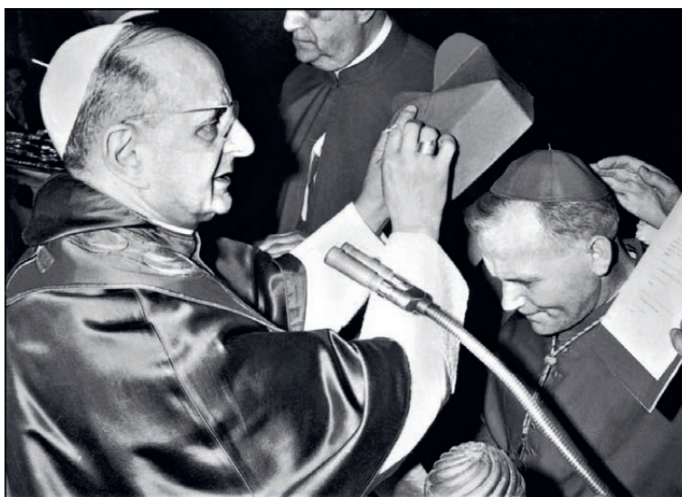
Paulus VI creëerde Karol Wojtyła in 1967 tot kardinaal.

Bovendien is het onderzoek tijdens een historisch proces feilbaar: men kan altijd vergissingen begaan. Het onderzoek kan tekort geschoten zijn of zelfs van bedrieglijke aard zijn. Het is altijd mogelijk dat men achteraf nieuwe getuigen of documenten vindt