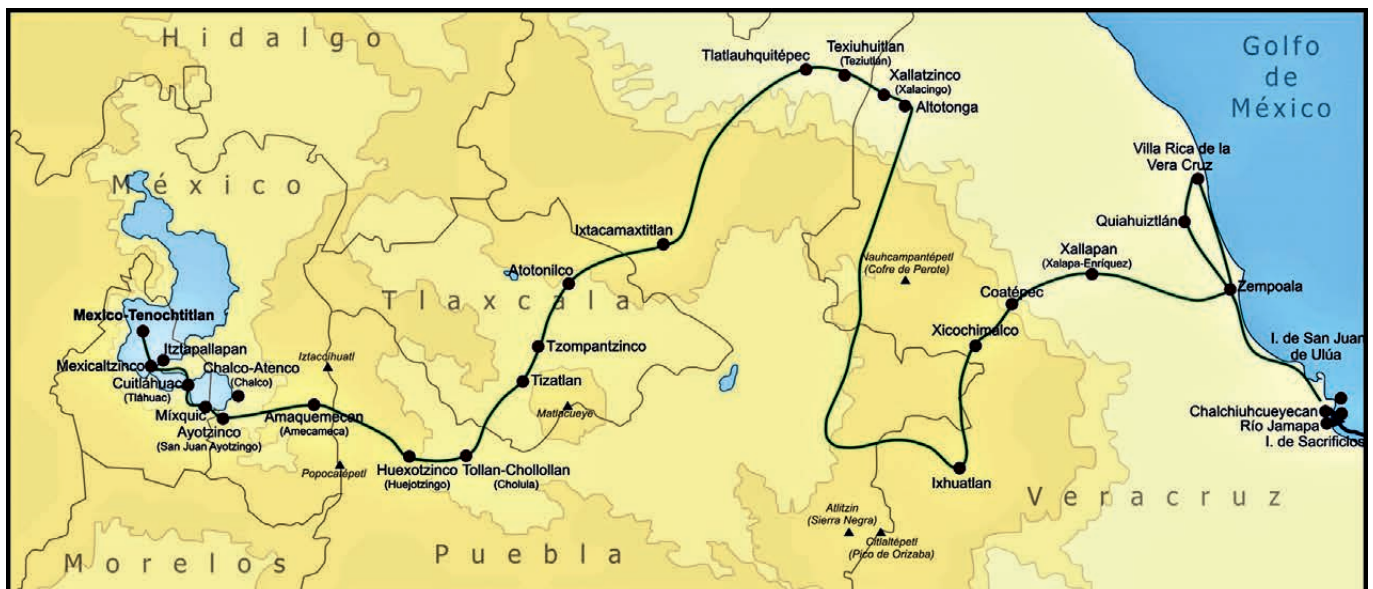
DE ROUTE VAN DE VEROVERAARS VAN DE KUST NAAR TENOCHTITLAN (maart-november 1519)

Net op dat ogenblik arriveert een indiaanse hoogwaardigheidsbekleder, gezonden door niemand