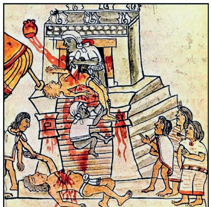
MENSENOFFERS OP DE TOP VAN EEN AZTEEKSE PIRAMIDE. De priester sneed met een mes van obsidiaan het hart uit een levend slachtoffer om het aan de godheid op te dragen. Afbeelding uit de in Firenze bewaarde Codex Magliabechiano, ca. 1550.

De Spaanse aanvoerder heeft om diplomatieke redenen het Tlaxcalaanse leger teruggestuurd, op 6000 strijders na die van hem buiten de stad moeten blijven. Chollollan ontvangt de vreemdelingen schijnbaar welwillend, maar tijdens hun verblijf bemerken de Spanjaarden dat de inwoners grote stenen op de daken stapelen en dat de straten geblokkeerd worden: ze zitten in de val! Onmiddell-