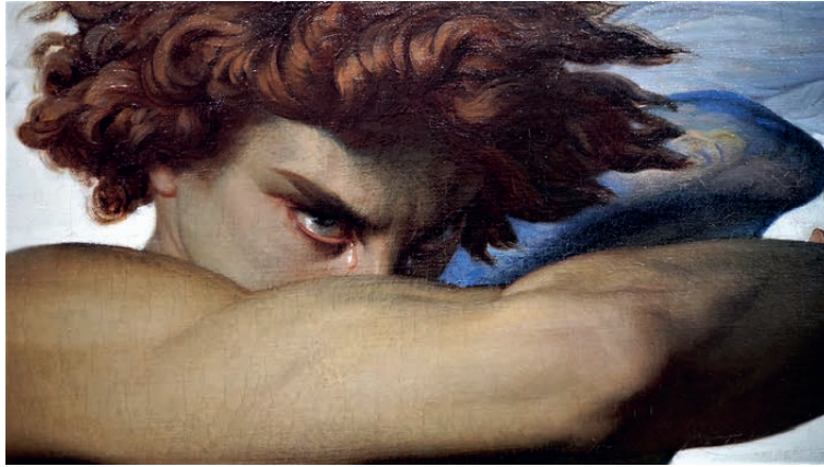
SATAN, DE GEVALLEN ENGEL :

Onder de invloed van de duivel werd de mens er na de zondeval echter van overtuigd om het mechanisme van het intellect om te keren. In plaats van een open geest te hebben, gericht op alle dingen van de natuur waarvan God de Schepper is, heeft de mens in zijn hoogmoed ontkend dat alles van de uitwendige wereld komt: hij heeft gedaan alsof hijzelf er in zijn geest de schepper van is, dat hij het centrum en het principe van zijn eigen kennis is. Men noemt dat het idealisme , dat nu al sinds bijna twee eeuwen