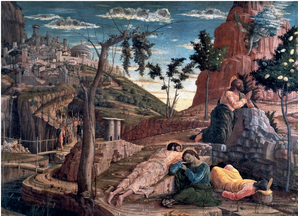
DE DOODSTRIJD IN DE HOF VAN OLIJVEN door Andrea Mantegna (1457-1459).

JEZUS beëindigt zijn toespraak tijdens het Laatste Avondmaal met de woorden: « Staat op. Laat ons heengaan. » Hoofdstuk 15 moeten we buiten beschouwing laten: deze zgn. “tweede afscheidsrede” is zeker niet door Hem uitgesproken onderweg naar de Cedronbeek. Vanaf 16, 16 vinden we echter de woorden terug die Jezus tot zijn apostelen richt terwijl ze zich samen naar de hof van Olijven begeven.