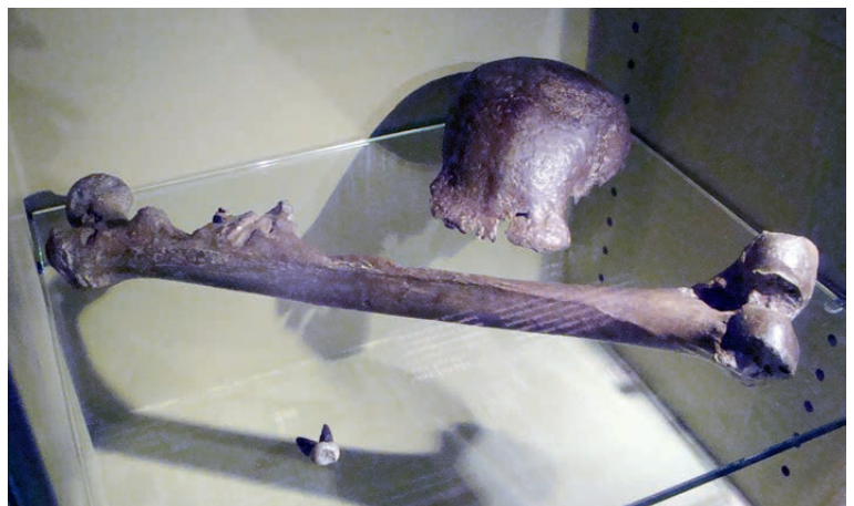
De fraude van Eugène Dubois: de combinatie van een apenschedel met een menselijk dijbeen werd voorgesteld als de « missing link ».

Niettemin houden de paleontologen het bedrog