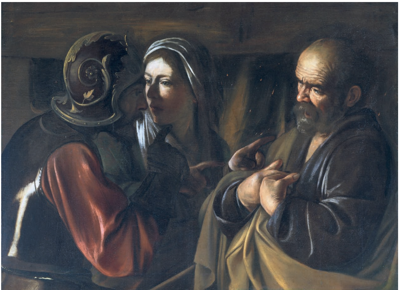
PETRUS VERLOOCHENT ZIJN MEESTER. Schilderij door Caravaggio uit 1610.

18 Daar het koud was, hadden de knechten en trawanten een kolenvuur aangelegd en stonden zich te warmen. Ook Petrus stond zich bij hen te warmen. De statische houding van de wachters en Petrus bij het vuur dient als achtergrondtafereel voor de confrontatie tussen Jezus en Annas die ondertussen in het paleis plaatsheeft.