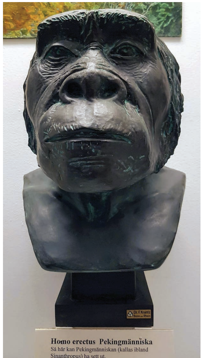
Homo erectus Pekingmänniska

Maar ondertussen heeft Weidenreich door een kunstenares een zo gezegd "model" van een vrouwelijk