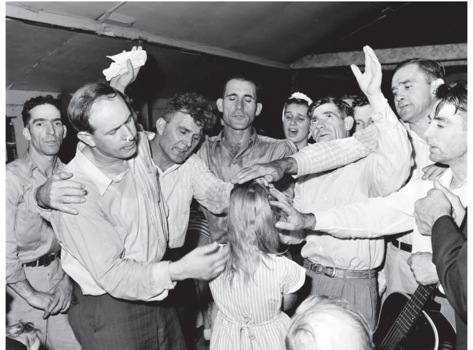
Leden van de Pinksterbeweging leggen een meisje de handen op met de bedoeling haar te genezen. Ceremonie in een protestantse tempel in Kentucky in 1946.