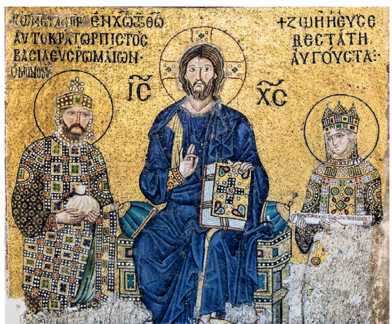
11 de -eeuws Byzantijns mozaïek in de Hagia Sophia in Istanboel: Christus Pantocrator troont tussen Constantijn IX Monomachos en keizerin Zoë. Constantijn, « keizer van de Romeinen » ( basileus Rōmaïōn ), regeerde van 1042 tot 1055. Onder zijn bewind voltrok zich, door toedoen van de trotse patriarch Michaël Keroularios, de breuk tussen de Oosterse Kerk en Rome.

Het pausdom zelf ging een van de meest miserebele periodes van zijn geschiedenis in. Tussen 896 en 1045 waren nagenoeg alle opeenvolgende pausen zwak, onbekwaam en onwaardig. Sommigen van hen compromitteerden zich in de politieke en religieuze