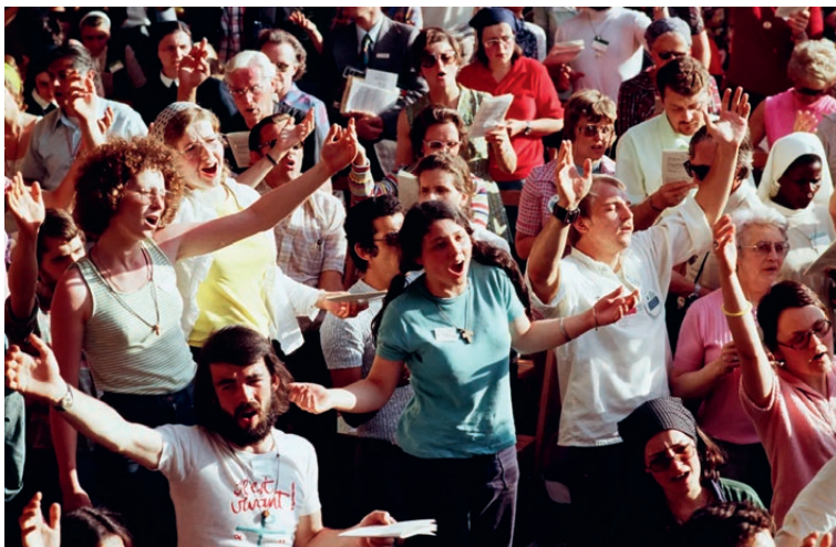
In de jaren 1970 begon de charismatische beweging zich stevig te verankeren onder zowel protestantse als katholieke gelovigen.

En de buitengewone genezingen ? De jansenisten die op het Parijse kerkhof van Saint-Médard bijeenkwamen op het graf van hun "heilige", diaken François Pâris, verrichtten genezingen die nog spectaculairder waren dan die van onze moderne charismatici ( ibid. , dl. IV, pp. 54-92). In het spoor van de kerkvaders zijn de katholieke theologen altijd van mening geweest dat wondertekenen in de schoot van de ketterij, in haar naam en tot haar voordeel, niet van God kunnen komen . Daarom beschouwden zij – vóór het Concilie ! – de Pinksterbeweging slechts als een nieuwe en bijzonder succesvolle sekte. De vreemde fenomenen die zich tijdens gebedsbijeenkomsten voordeden, schreven zij zonder enige aarzeling toe aan de macht van de Geest der duisternis, te vergelijken met