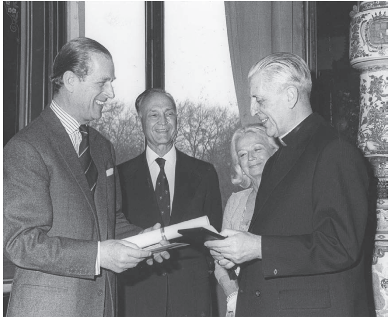
In 1976 ontving de Belgische kardinaal Leo Jozef Suenens uit handen van de hertog van Edinburgh de prestigieuze Templetonprijs « voor zijn bijdrage aan het onderzoek aangaande spirituele realiteiten ». De progressistische Mechelse aartsbisschop was toen al jarenlang de grote promotor van de charismatische vernieuwing in de Kerk.