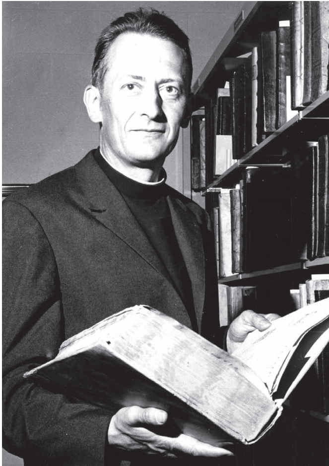
ABBÉ RENÉ LAURENTIN