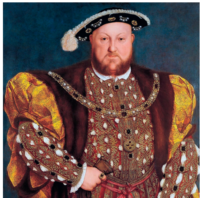
KONING HENDRIK VIII (1491-1547)