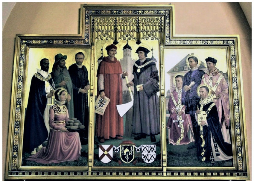
Engelse katholieke martelaren van de protestantse Hervorming, met op het middenpaneel de H. John Fischer en de H. Thomas More. Schilderij in Ushaw College, een voormalig katholiek seminarie (gesticht in 1808) in Noord-Engeland.

« Het lijden is slechts een spookbeeld dat verdampst wanneer men het nauwkeuriger bekijkt. » Voor de christen is de dorst naar de goddelijke vertroosting het bewijs van Gods grote bekommernis. « Welke grote troost is het om in ons dat verlangen te voelen, te beseffen dat onze Heiland, met het oog op onze zaligheid, zo goedgunstig met ons bezig is! De onverschrokkenheid die daardoor van hem [de gevangene] bezit neemt, doet in hem een zo grote