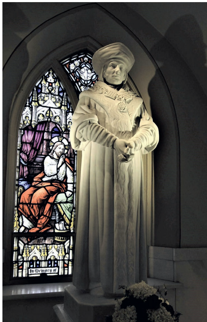
Standbeeld van de heilige in de Basilica of Saint Mary, Alexandria, Virginia.

Thomas More van zijn kant reageert op Luther niet meer als humanist, maar als een nederige gelovige van de katholieke Kerk. Zijn houding