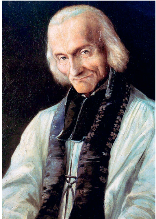
De H. Pastoor van Ars, Jean-Marie Vianney (1786-1859), besepte maar al te goed dat de dans van de Revolutie geleid werd door de duivel, die hij 41 jaar lang bekampte in zijn kerk, zijn pastorie en zijn biechtstoel. Op een dag siste de duivel hem toe : « Als er drie zoals jij op aarde zouden zijn, dan was het gedaan met mijn heerschappij ! »

« De Kerk zal in de ideeën en instellingen van de democratie zelf de wapens en middelen vinden die