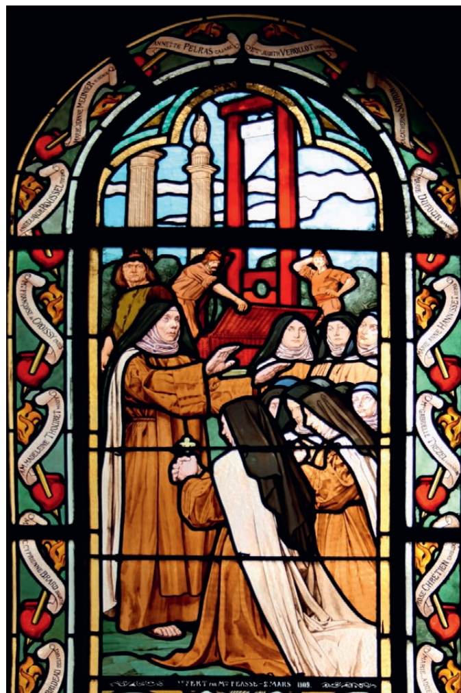
De zestien Z. Karmelietessen van Compiègne stierven de marteldood onder de guillotine in Parijs op 17 juli 1794, op beschuldiging van « fanatisme en rebellie ». De door en door antichristelijke Franse Revolutie maakte van de Kerk in de 19 de eeuw een citadel van de Contrarevolutie.

« God heeft gezegd: “Gij zult niet doden, zij zult niet stelen, zij zult niet vloeken, zij zult niet lasteren” enz. De H. Teresia was trouw aan deze voorschriften, of nauwkeuriger gezegd aan deze natuurwet van God, aan deze algemene wet van God. Je zal me zeggen: natuurlijk, ik mag hopen van wel! Maar weet je hoe ze daar trouw aan was? Je zal opkijken: ze was trouw, net als haar ouders, net als haar oom, door een legitimist te zijn [een aanhanger van de wettige monarchie van de Bourbons]. Legitimist? Ja! Door een royalist te zijn! Royalist? Wat heeft dat te maken met “Gij zult niet doden, zij zult niet liegen, zij zult niet stelen”? Dat is toch duidelijk als je even nadenkt: hoe kan je verwachten dat een heilige, die van God “Gij zult niet doden” heeft geleerd, haar hand kan leggen in de hand van de revolutionairen, van de beulen en koningsmoordenaars van 1789 en 1793? Nooit! Ik wil