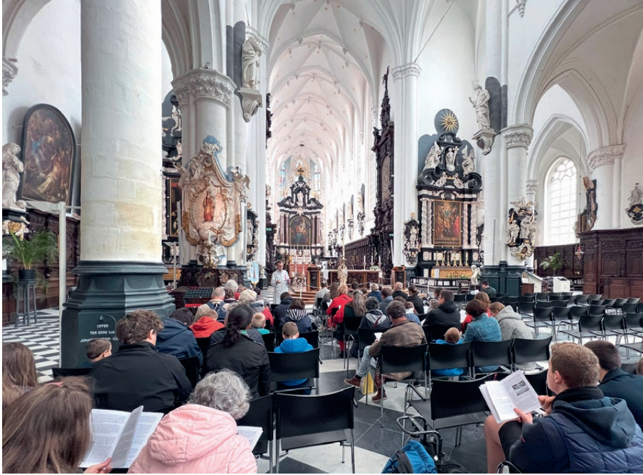
Sint-Paulus, de voormalige kerk van de dominicanen in Antwerpen, is werkelijk « een barok juweel in een gotisch schijn ».