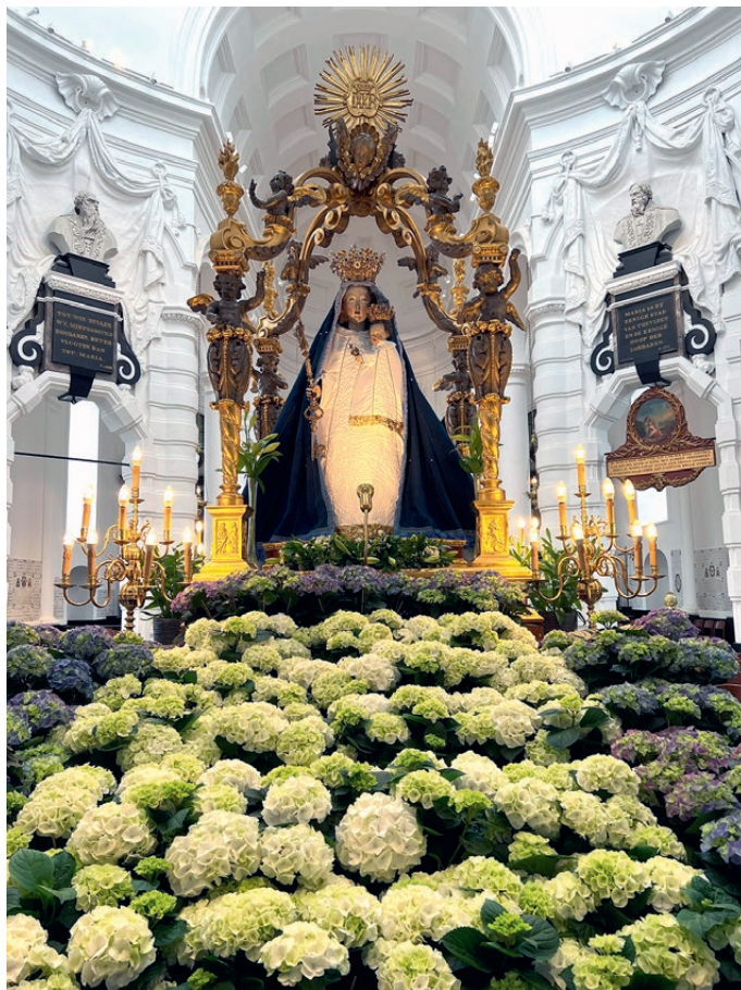
ONZE-LIEVE-VROUW VAN HANSWIJK : « Toon dat Gij Moeder zijt ! »

Wat konden we dan beter doen om trouw te blijven aan die geest van Contrareformatie, die de katholieke Renaissance aankondigt en voorbereidt, dan in deze kerk het rozenhoedje te bid-