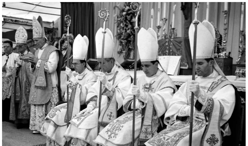
Op 30 juni 1988 wijdde Mgr. Lefebvre zonder toestemming van de paus vier bisschoppen, wat tot zijn excommunicatie leidde.

Toen deze beginselen eenmaal vaststonden, ging abbé de Nantes aan de slag met het bestuderen van de aan de gang zijnde liturgische hervorming en van de belangrijkste kwestie die de Kerk in Frankrijk zo in beroering bracht: de geldigheid van de nieuwe Mis. Hij zag voor die geldigheid twee doorslaggevende bewijzen. Het eerste was een intern bewijs, voortvloeiend uit de theologische bestudering van de tekst van de nieuwe ordo : die