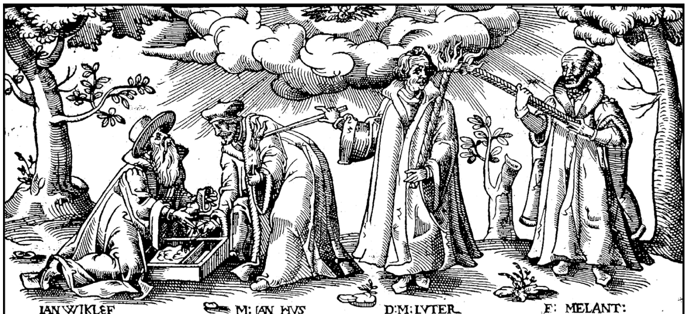
Gravure uit een 16de-eeuws hussietisch liederenboek : John Wyclif, Jan Hus, Maarten Luther en Philipp Melanchthon.

Hoe staat de Rooms-katholieke Kerk tegenover die decadentie ? Vanaf het Concilie van Trente tot aan de Z. Pius IX en de H. Pius X heeft zij gestreden tegen de protestantisering en tegen de aanspraken van de eigengereide liberale staat. Maar sinds het Tweede Vaticaans Concilie heeft zij zich met de constitutie GAUDIUM ET SPES officieel aangesloten bij het heidense humanisme en de