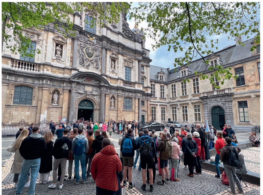
Met de bouw van hun barokke kerk in Antwerpen, vandaag gewijd aan Sint-Carolus Borromeüs, leverden de jezuïeten een architectonisch meesterwerk af.