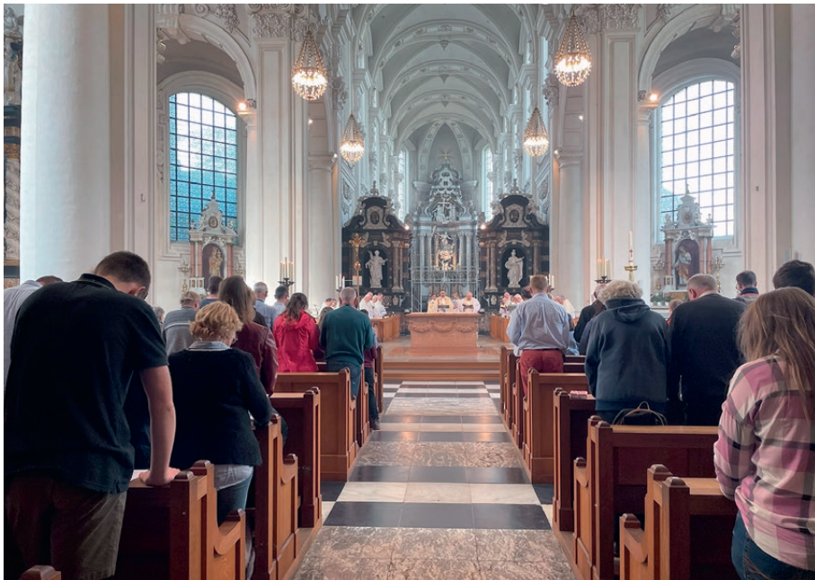
In de abdijkerk van Averbode baden we samen met de paters de vespers.