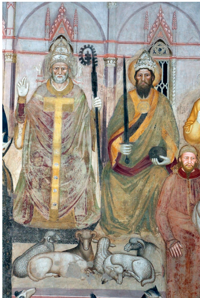
Paus en keizer, de geestelijke en de wereldlijke macht. Pas na eeuwen van confrontatie kwam de Kerk tot het inzicht dat een mozaïek van koninkrijken, vorstendommen en vrije steden veruit te verkiezen was boven een oppermachtig Rooms keizerrijk. Fresco door Andrea Bonaiuti in de kerk van Santa Maria Novella in Firenze (1365-1367).

Meer nog dan de Turkse dreiging kondigde de ketterij van Jan Hus (1369-1415), die een groot deel van Bohemen voor zijn denkbeelden kon winnen, de toekomstige stormen aan. Hus koppelde radicale kritiek op de Kerk en de katholieke dogma's aan een revolutionair Tsjechisch nationalisme dat erg aansloeg. In een hussietisch liederenboek uit de 16 de