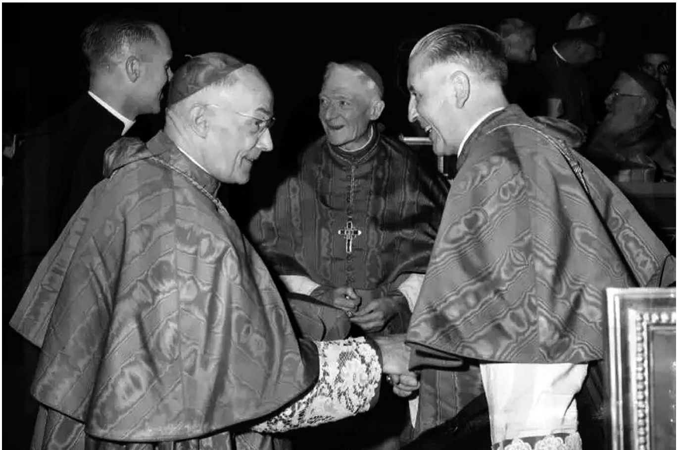
Drie van de hoofdtenoren van de progressistisch-modernistische lobby die er zou in slagen het hele Tweede Vaticaans Concilie naar zijn hand te zetten : links de Duitse kardinaal Frings, in het midden de Franse kardinaal Liénart en rechts de Belgische kardinaal Suenens. Met de steun van Joannes XXIII en Paulus VI drukten zij hun nieuwlicherijen door.

GAUDIUM ET SPES staat in extase voor de mens, zijn lichaam, zijn verstand, zijn geweten, zijn vrijheid. En verderop, onder nr. 12, durft de constitutie verklaren : « Gelovigen en ongelovigen zijn het er bijna unaniem over eens dat alles op aarde betrokken dient te worden op de mens, als het middelpunt