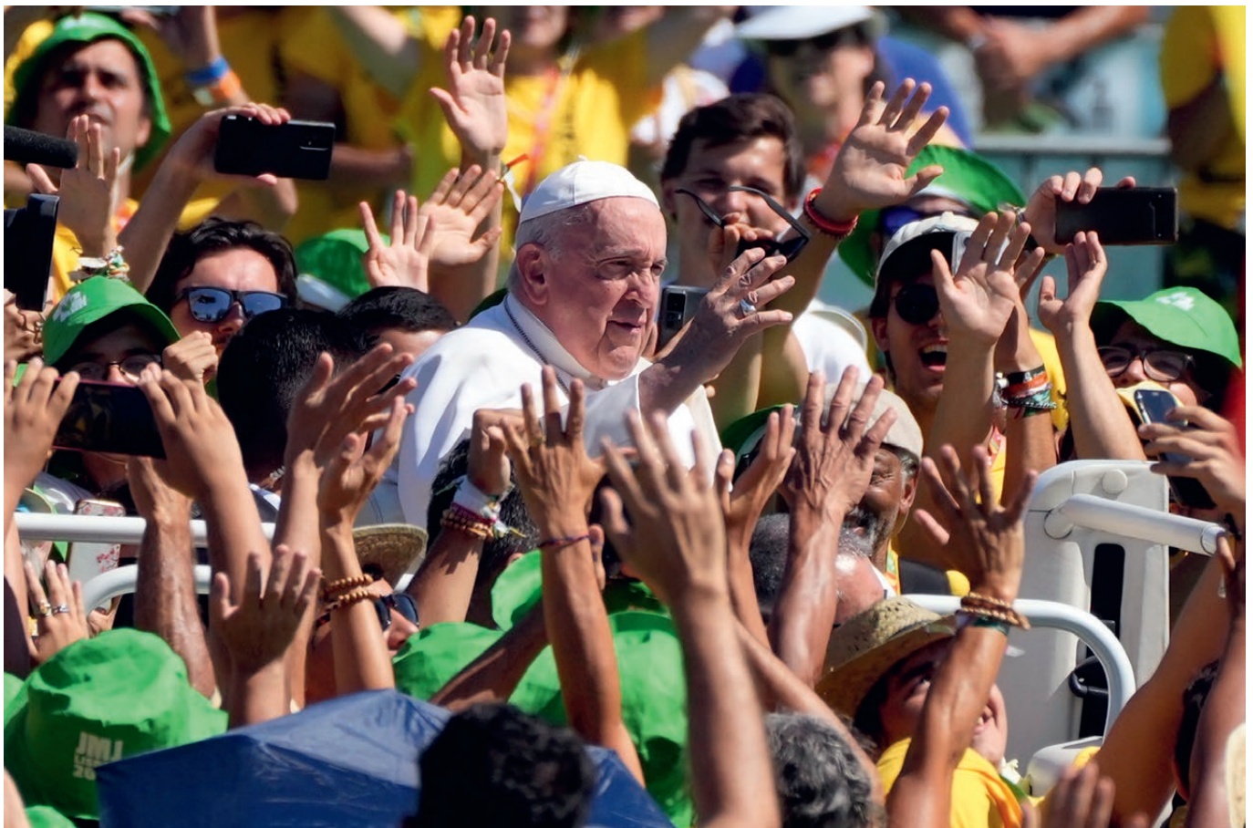
Paus Franciscus op de Wereldjongerendagen in Lissabon, 6 augustus 2023 : « Todos ! Todos ! Todos ! »

Het gevolg van die visie is het alles overheersende medelijden van de paus met de migranten, dat hem elke voorzichtigheid en politieke wijsheid doet verliezen. Die compassie deed hem zijn eerste reis maken naar het eiland Lampedusa (8 juli