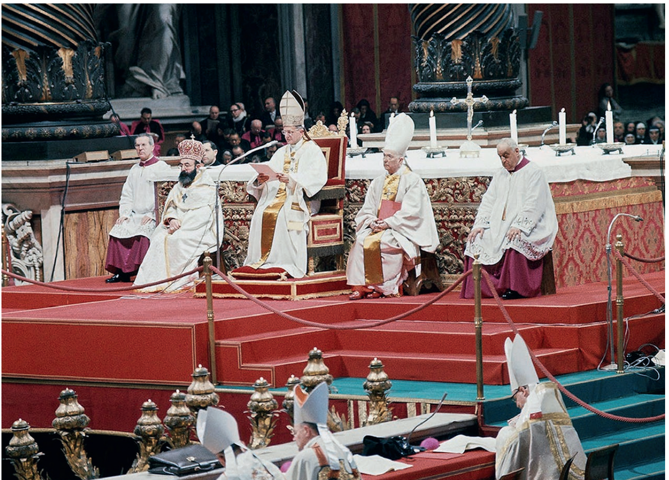
Paulus VI kondigt op 7 december 1965 in de Sint-Pietersbasiliek de laatste conciliedocumenten af, onder meer de pastorale constitutie GAUDIUM ET SPES over de Kerk in de wereld en de verklaring over de vrijheid van godsdienst DIGNITAS HUMANA. Daarmee dwong hij de Kerk een noodlottige weg op, wat zich snel zou wreken.

« De Kerk van Jezus Christus kan geen enkel recht toekennen aan andere religies of ongodsdienstige levensbeschouwingen en zij betreurt de rechten die deze verworven hebben. Zeker, de Kerk dwingt niemand ertoe zijn redding te verkrijgen tegen zijn dwalend of op een dwaalspoor gezet geweten in. Maar zij heeft het recht om op het openbare domein alle manifestaties van deze door de duivel ingegeven dwalingen te bestrijden en te verbieden. Zij mag alles wat overeenstemt met het katholieke geloof en de moraal opleggen aan alle onderdanen van een katholieke staat » (AUTODAFÉ, p. 138). Een moslim mag in zijn hart zijn islamitisch geloof belijden, maar het publiek promoten van deze valse godsdienst door de bouw van moskeeën zou in een christelijk land ten strengste verboden moeten zijn. De dwaling heeft geen enkel recht om zich in de maatschappij te verspreiden.