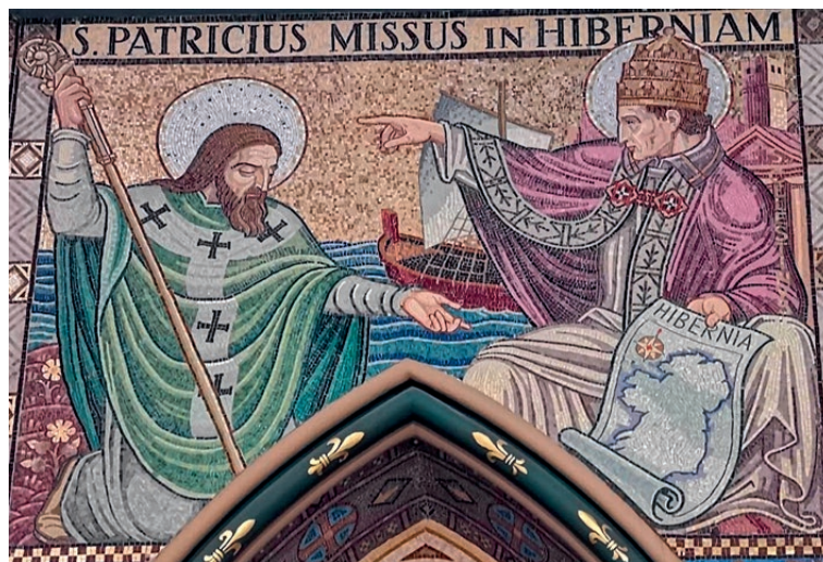
PAUS CELESTINUS I ZENDT DE H. PATRICK OP MISSIETOCHT NAAR IERLAND

jagen, te vissen en zich in het balspel te bekwamen ! En ook 's avonds kwamen de boeken er niet meer aan te pas, want dan moest hij zich laten masseren en parfumeren in de openbare baden waar hij met zijn kameraden de laatste nieuwtjes uitwisselde. Ook zijn religieuze vorming stelde blijkbaar niet veel voor, want hij schrijft zelf : « Ik was vijftien jaar en ik geloofde niet in de levende God. » Over die nonchalante en losbollige jeugd geeft