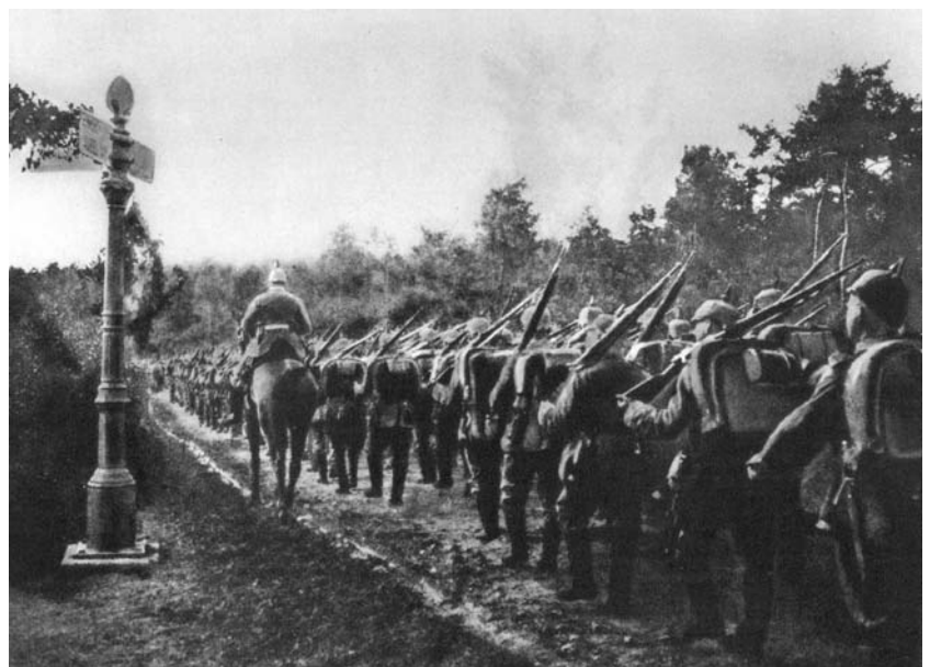
Op 4 augustus om 9 uur's morgens staken de eerste Duitse troepen de Belgische grens over en was de oorlog een feit. Op de wegwijzer staan de namen van de steden Aken en Luik, in vogelvlucht nog geen 40 km van elkaar verwijderd.

Voor de laatste keer in vreedstijd trekt de Brus-