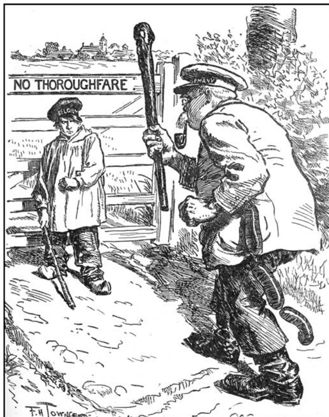
Het « dappere kleine België » dat het brutale Duitsland de vrije toegang tot zijn grondgebied weigerde, dwong de bewondering van de hele wereld af.

De koning was opgelucht, temeer omdat het land kort tevoren door een ernstige crisis was gegaan. Midden in de debatten over de uitbreiding van de dienstplicht, die het hele voorjaar van 1913 duurden, besloten de socialisten tot een krachtmeting met de regering om het algemeen stemrecht af te dwingen. Zij dreigden met een grote staking