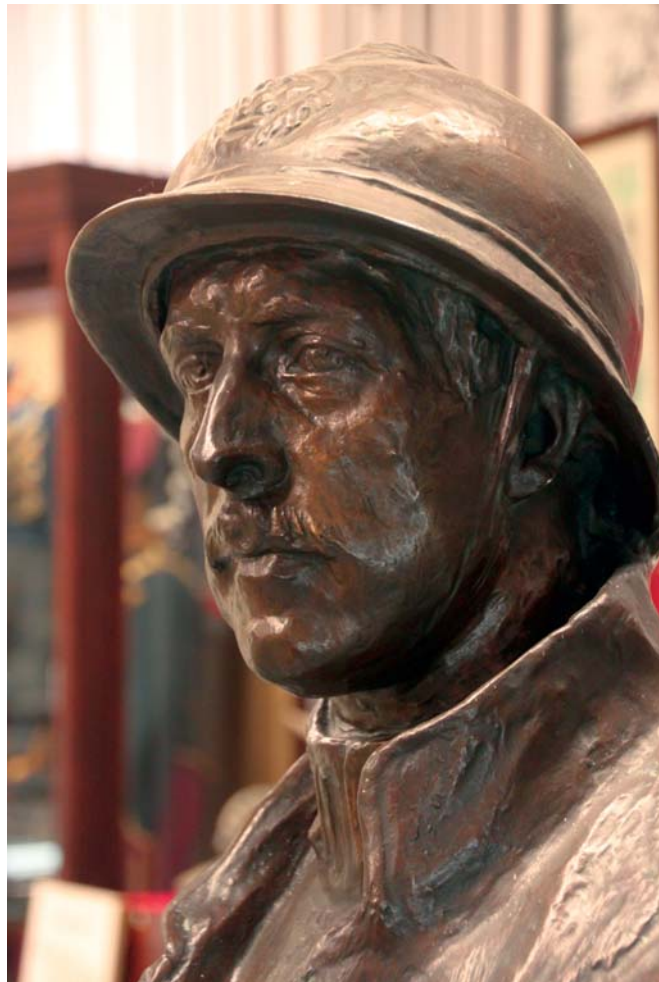
BORSTBEELD VAN KONING ALBERT I. Museum Halen.

Ons land had sinds de onafhankelijkheid van 1831 geen oorlog meer gekend. De grote mogendheden hadden met het verdrag van Londen de neutraliteit en veiligheid van België plechtig erkend en gegarandeerd. Het Verenigd Koninkrijk was onze voornaamste waarborg: het zou nooit toestaan dat