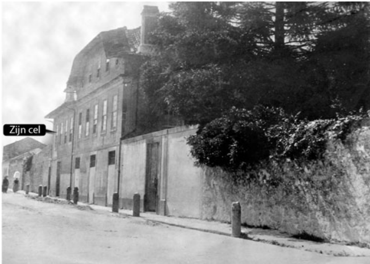
Het Instituut van de Goede Herder in Porto, na de restauratie van het klooster door Moeder Maria. Foto uit 1900.

Zoals we zullen zien, waren deze zielen niet alleen die van de boetvaardige meisjes over wie zij de zorg had, maar die van heel Portugal: voor de bekering van dat land zou ze werken en zichzelf offeren, zodat ze op die manier de weg bereidde voor Onze-Lieve-Vrouw.