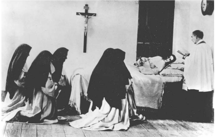
Op 8 juni 1899 ontving de vertrouweling van de Hemel het viaticum. Enkele uren later liepen twee grote tranen uit haar ogen en schonk ze « zachtjes, heel zachtjes » haar mooie ziel terug aan haar goddelijke Bruidegom.

Vanaf dat moment begon moeder Maria erg te lijden door de systematische weigering van haar geestelijke vader om de verzoeken van de Hemel door te geven aan Rome. Zij wist welke negatieve