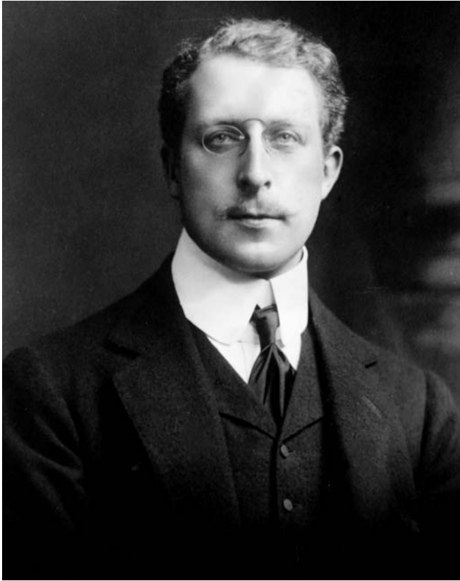
De 35-jarige koning op 12 april 1910, enkele maanden na zijn troonsbestijging.

slagkracht. « Het is een ernstige vergissing de verdragen te beschouwen als engagements die door geen enkele omstandigheid kunnen gewijzigd worden. In de politiek bindt een engagement aangaan in een verdrag enkel tot aan een volgende oorlog, die vaak wordt verklaard om van lastige engagements af te geraken » ( ibid. , p. 82).