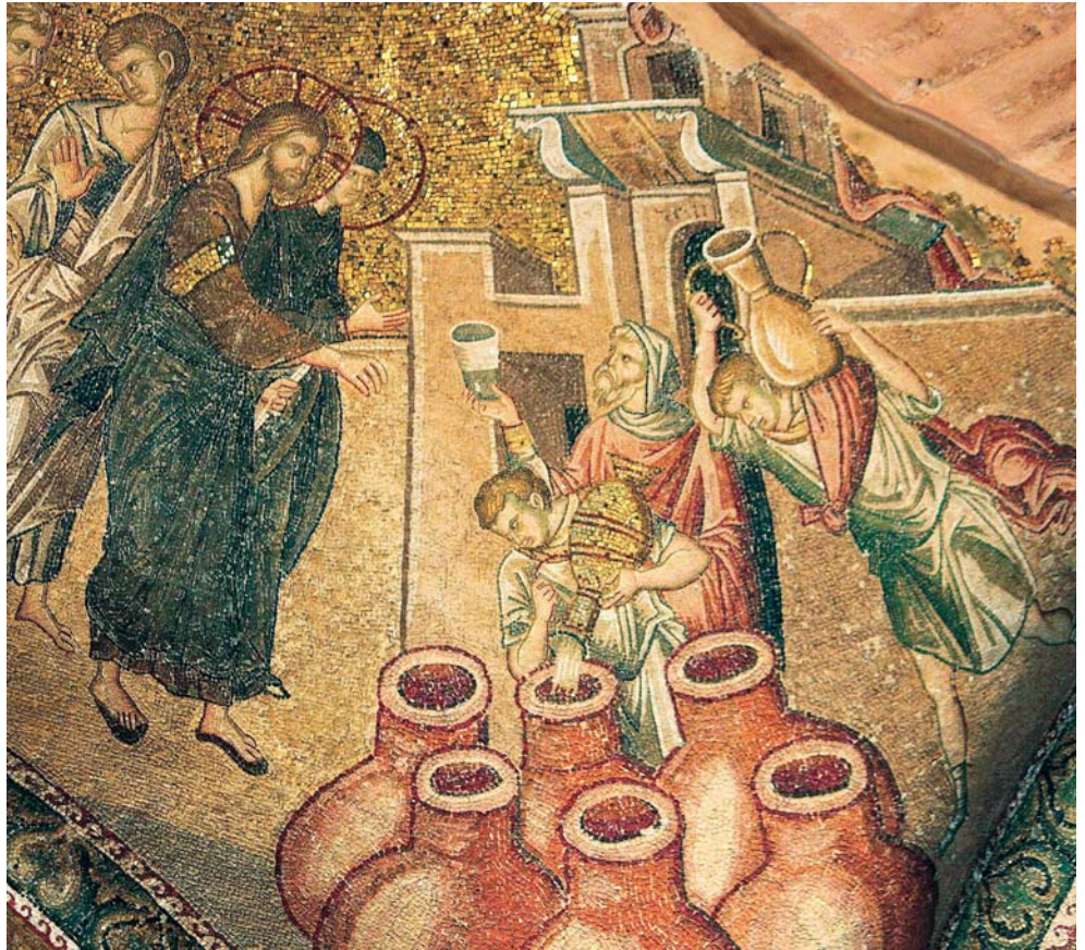
JEZUS OP DE BRUILOFT VAN KANA.

In de menselijke liefde is het genot om zo te