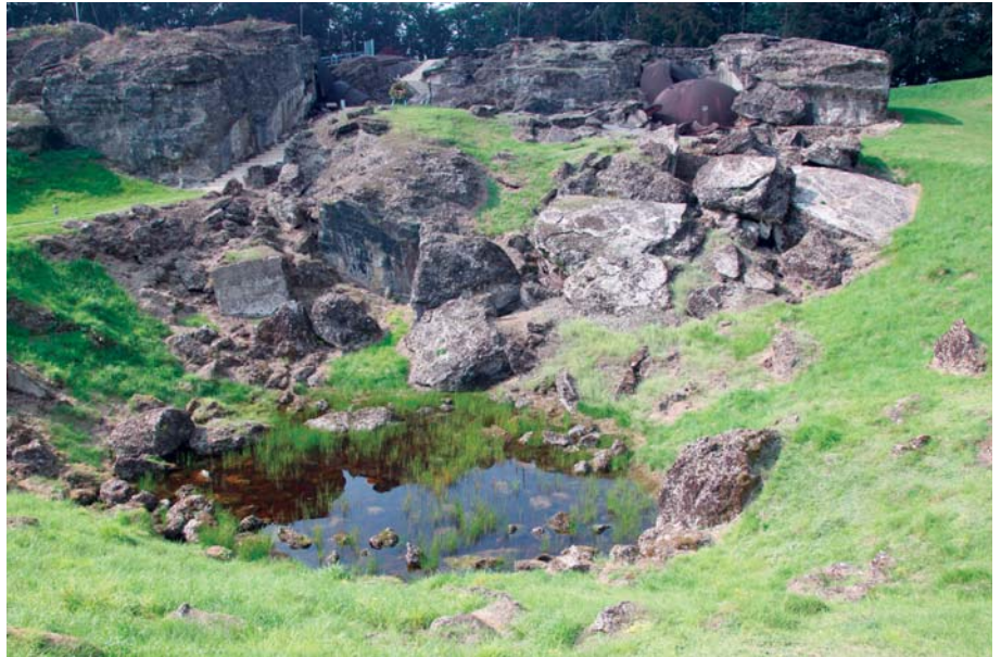
Op 15 augustus 1914 deed een Duitse voltrefter in de kruithamer het fort van Loncin exploderen. Op de voorgrond de bomkrater, op de achtergrond het kerkhof van beton en staal waaronder voorgoed de stoffelijke resten van 175 militairen rusten.

En dan is het wachten op de komst van een geheim wapen: twee kanonnen van een ongekend zwaar kaliber, monsters zoals de wereld er nog nooit aanschouwd heeft. De houwitsers die bekend zullen worden als de Dikke Bertha's , naar de naam van de dochter van wapenfabrikant Krupp, hebben een loop met een doorsnede van maar liefst 42 cm en overtreffen al het bestaande wapentuig. Ze wegen elk 150 ton. Op 10 augustus worden de onderdelen in Essen op een trein geladen richting Aken, waarna ze in de late avond in Herbesthal arriveren. Verder transport moet langs de weg gebeuren, want de spoorwegtunnel is geblokkeerd. Tien zware wagens