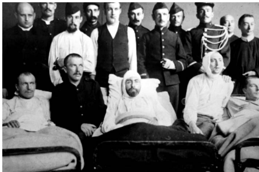
Gewonden in de ziekenboeg van Loncin.

« Om halfzeven donderde de eerste knal over Luik. De granaat steeg in een boog tot een hoogte van meer dan 1000 meter en had zestig seconden nodig om zijn doel te bereiken. Toen het dat raakte, steeg een grote, kegelvormige wolk van stof, rook en puin wel een paar honderd meter omhoog » (Tuchman, ibid. ).