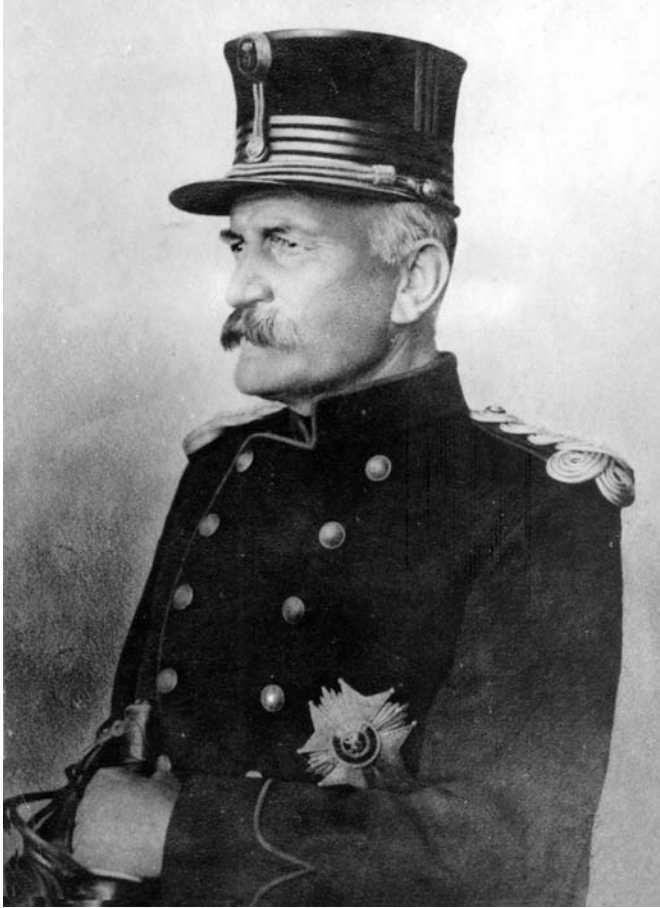
Generaal Gérard Leman (1851-1920).

schootsveld vóór de forten, dat in theorie vrij moest blijven van bebouwing, stond ondertussen vol huizen, schuren en boomgaarden, waardoor de vijand ongezien naderbij kon komen. De intervallen tussen de bolwerken (ze lagen gemiddeld 4 km van elkaar vandaan) waren niet voorzien van verdedigingswerken, zodat elk fort in feite een eiland was.