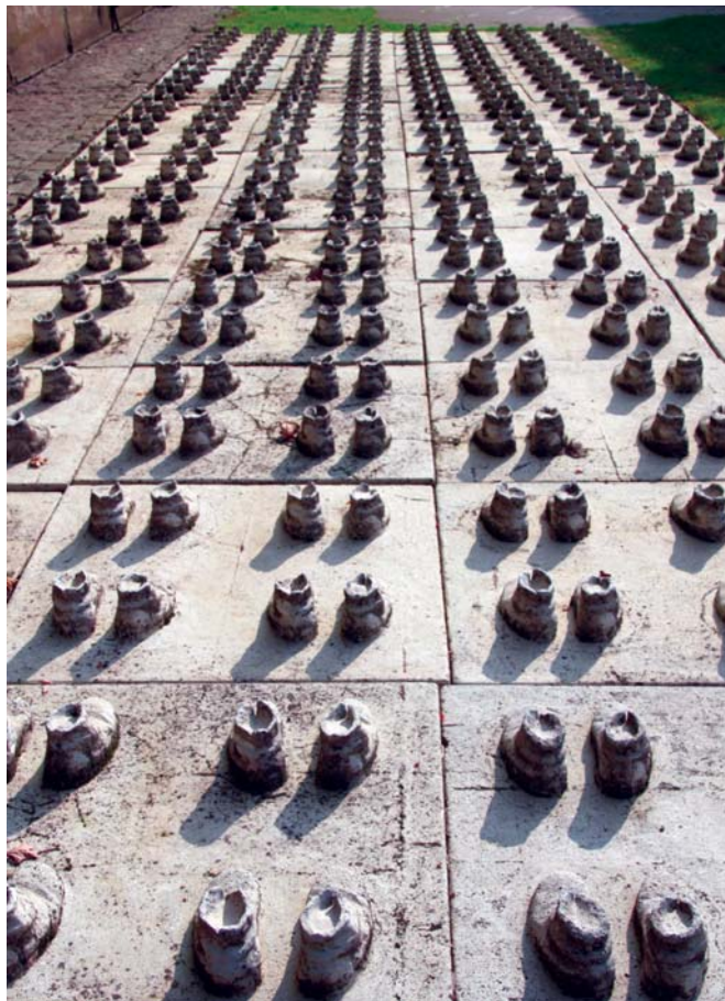
Op de eerste dag van de Duitse invasie legden de soldaten van Loncin tegenover hun commandant een plechtige eed af : « Nooit zullen wij ons overgeven ! » Op de binnenkoer van het fort herinnert een ongewoon maar aangrijpend gedenkteken aan de plek waarop deze eed werd afgelegd.

Het grote nadeel was echter dat de forten tussen 1892 en 1914 niet gemoderniseerd waren. Het leger slorpte al geld genoeg op, oordeelden de politici... Het betonnen pantser van de forten was bestand tegen inslagen van 21 cm-geschut, maar niet tegen de zwaardere granaten waarover het Duitse leger volgens de militaire inlichtingendiensten ondertussen beschikte. Er was nog meer dat niet deugde : het