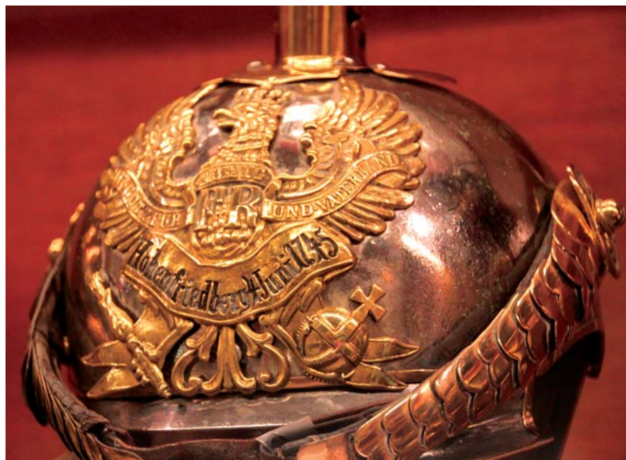
Een van de fameuze « zilveren helmen » die de verslagen Pruisische cavalerie op het slagveld achterliet.