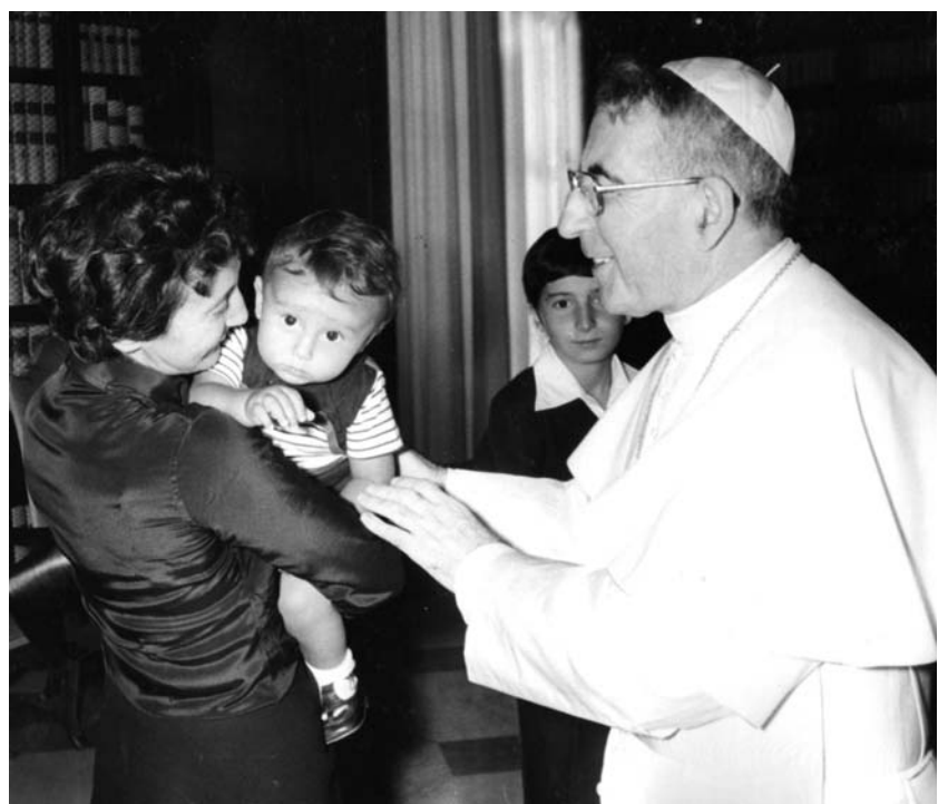
Familiebijeenkomst bij papa Luciani in het apostolisch paleis.