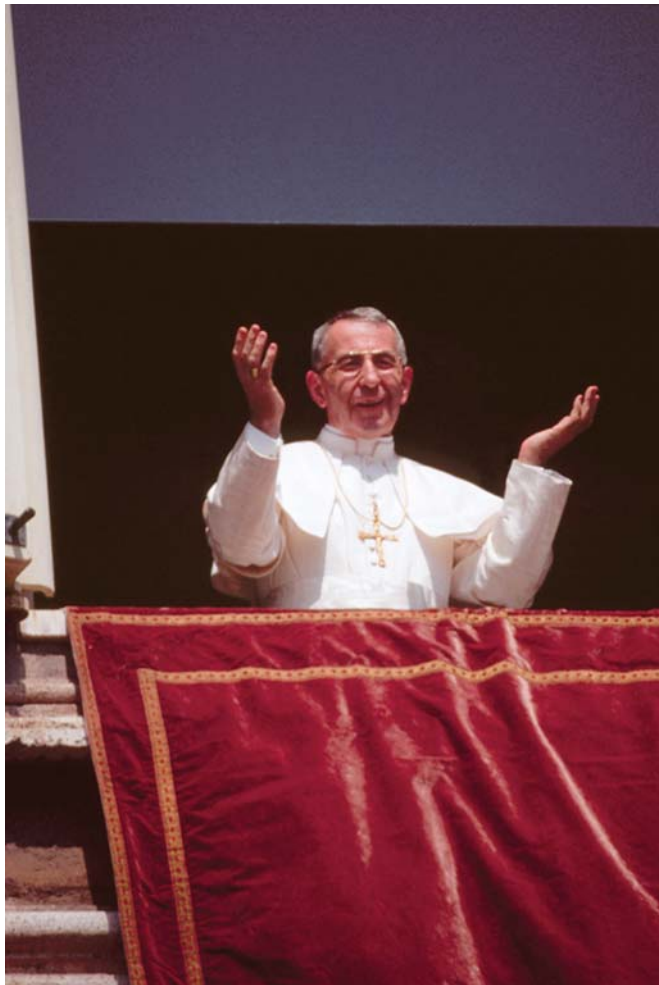
De paus tijdens het Angelus.

In zijn eerste boodschap aan de katholieken over de hele wereld, op 27 augustus, gaf Joannes-