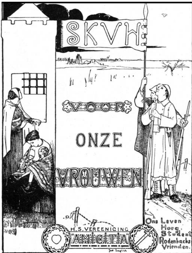
English tekende voor het SKVH sluitzegels, die de frontsoldaten op hun briefomslagen kleefden.

Het SKVH brengt met de medewerking van hoofdaalmoezenier Marinis ook Vlaamse en Franse boeken over het gevaar van geslachtsziekten in omloop. Er komt verder een leenbibliotheek van wetenschappelijke boeken tot stand: Daels beschouwt geestelijke arbeid immers als een probaat middel tegen de zedeloosheid.