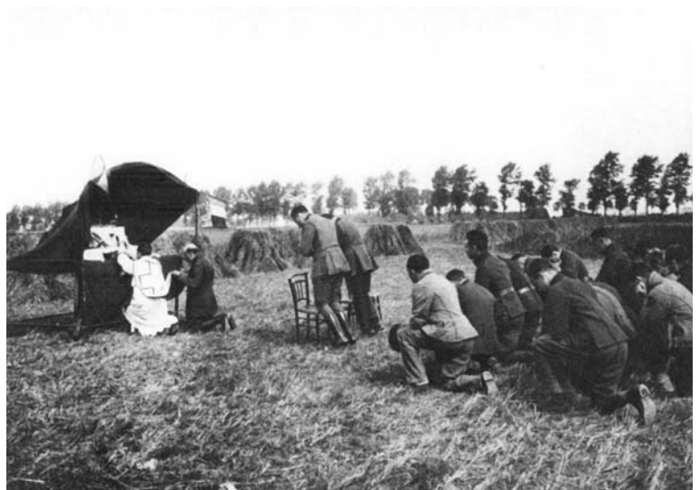
Een aalmoezenier draagt aan het front het H. Misoffer op voor officieren en soldaten. Pervijze, zomer 1915.