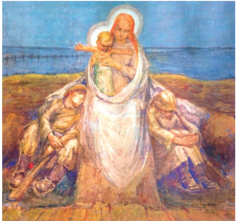
Onze-Lieve-Vrouw van de IJzer. Schilderij door Joe English, 1916.