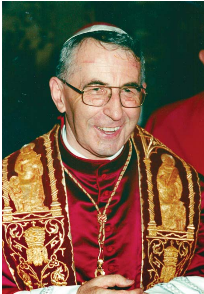
ALBINO LUCIANI, PAUS JOANNES-PAULUS I.

« Plots stijgt een enorm geroep op: “Mirakel! Mirakel!” De houding van de massa doet denken aan het Bijbelse beeld van het Godsvolk waaraan Jahweh verschijnt. Iedereen staart vol verbazing, met ingehouden adem en het hoofd ontbloot, naar de hemel: de zon is losgekomen van het uitspan-