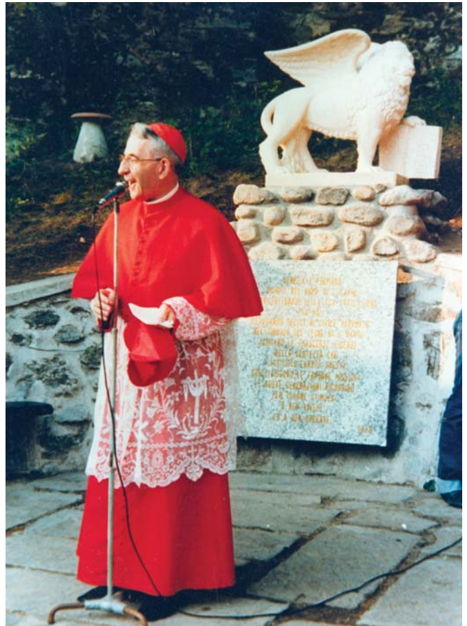
PATRIARCH VAN VENETIË.

Alleen kardinalen hebben door een bijzonder privilege het voorrecht om de clausuur van de