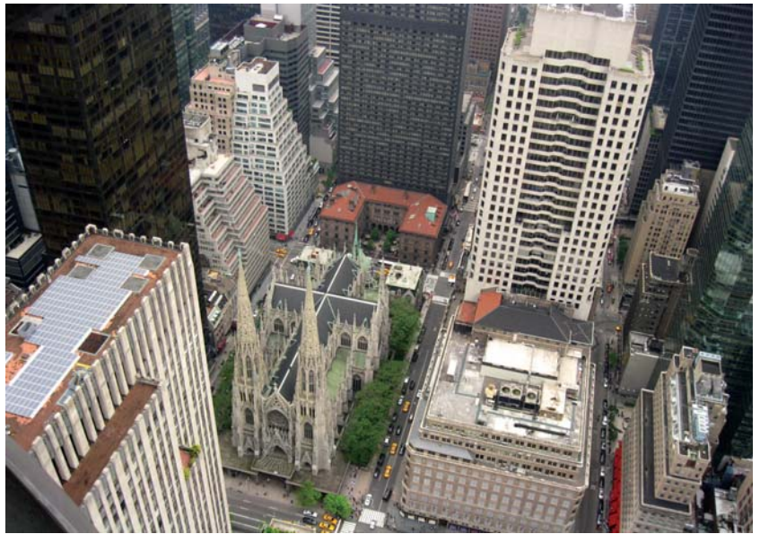
De Rooms-katholieke kathedraal van Sint-Patrick in New York wordt volledig overschaduwd door de wolkenkrabbers van het Amerikaans kapitalisme : een metafoor voor de geschiedenis van de Kerk in de VS.

In 1932 zal de voorkeur van de democratische partij opnieuw naar een protestant uitgaan, Franklin D. Roosevelt, die verkozen wordt. De nieuwe president wacht tot 1936 alvorens hij officieel een vertegenwoordiger van de paus durft ontvangen, namelijk kardinaal Pacelli (de latere Pius XII). En die wordt dan nog uitgenodigd in de privéwoning van Roosevelt, niet op het Witte Huis ! Het zal pas het uitbreken van de Tweede Wereldoorlog zijn dat de president de gelegenheid verschaft om een persoonlijke vertegenwoordiger bij het Vaticaan te benoemen, met de rang van ambassadeur.