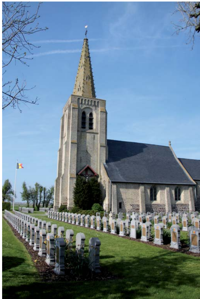
In Vlaamse velden: het oorlogskerkhof van Oeren, tussen Veurne en Alveringem. In de schaduw van de oude Sint-Pietersbandenkerk rusten 508 Belgische militairen.

Is Groot-Brittannië dan niet beter af? « In Engeland is het niet beter gesteld, het is erger dan een republiek. De ministers hebben alles te zeggen en de vorst niets, men houdt zich zelfs niet met hem bezig,