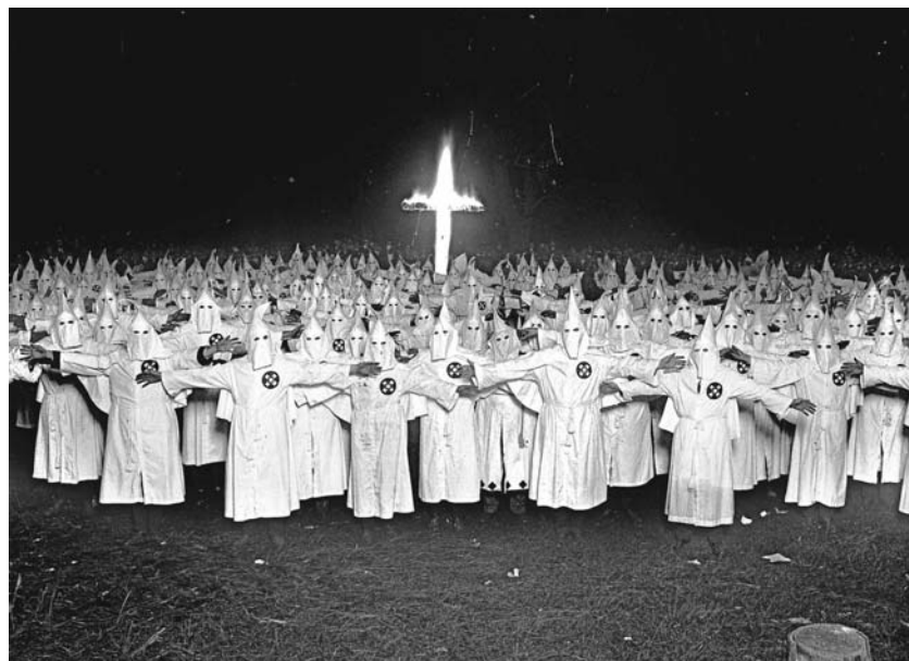
Een massabijeenkomst van de Ku Klux Klan in Chicago, april 1921. De KKK wordt verkeerdelijk alleen geassocieerd met racisme tegen de zwarte bevolking; de beweging was evenzeer fel anti-Joods en antikatholiek.

maar zo goed mogelijk op te schieten met de andere belijdenissen was dat het katholiek geloof verflauwde, dat het zijn zout verloor. De godsdienstvrijheid, het respect voor de dwaling bij de anderen, de aanvaarding van het neutraal openbaar onderwijs, de verheerlijking van de democratie met haar waarden van individuele vrijheid en sociaal succes, hebben een gevoel van religieuze onverschilligheid geschapen dat, gevoegd bij de zoektocht naar materieel comfort, fataal was voor het geloof van een groot aantal katholieken. Dat is de diepere oorzaak van het hoge aantal gevallen van apostasie dat de Kerk in de VS altijd heeft moeten betreuren. De doorsnee Amerikaan is er trouwens van overtuigd dat de Kerk verlaten en zijn eigen godsdienst kiezen niet betekent dat men minder religieus wordt, vermits alle godsdiensten gerespecteerd moeten worden.