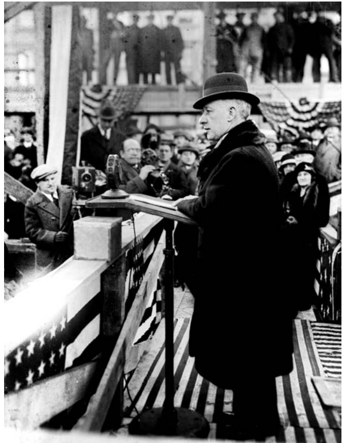
De graag geziene katholieke politicus Alfred "Al" Smith (1873-1944) tijdens een meeting. Tussen 1918 en 1928 werd hij viermaal tot gouverneur van New York gekozen. Omwille van zijn geloofsovertuiging werd hij echter geboycot in zijn presidentiële ambities.

Maar omdat de Kerk in de VS tot elke prijs een botsing wou vermijden, werd ze ertoe verleid te onderstrepen wat gemeenschappelijk was met de sekten en haar verschillen te relativiseren. De katholieken willen meer nog dan de anderen hun gehechtheid aan de Amerikaanse politieke instellingen tonen, ze zijn nog vaderlandslievender dan alle anderen, ze sluiten ook de godsdienstvrijheid meer in hun hart dan gelijk wie anders. Het resultaat van die ijver om toch