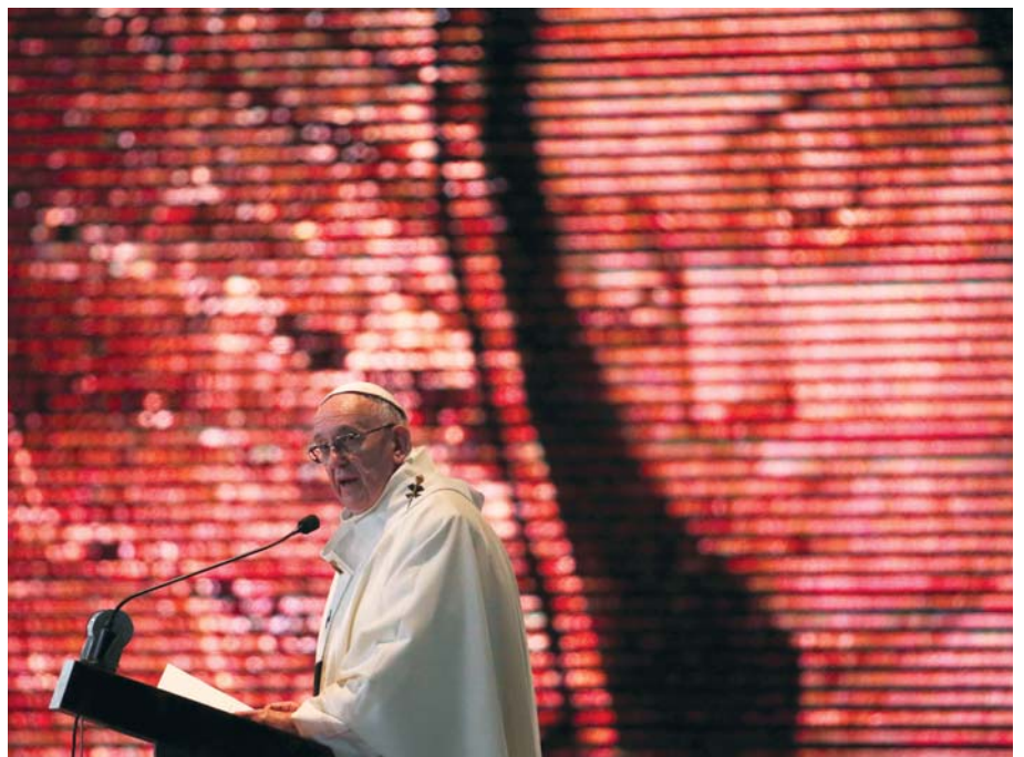
Paus Franciscus onder de liefdevolle blik van de H. Maagd van Guadalupe, patrones van Mexico (13 februari 2016).

De pauselijke catechese van 20 januari 2016 was gewijd aan het thema van de « Gebedsweek voor de eenheid en de barmhartigheid », geput uit de eerste Brief van de H. Petrus : « Vroeger van genade verstoken, nu begenadigd » (1 P 2, 10).