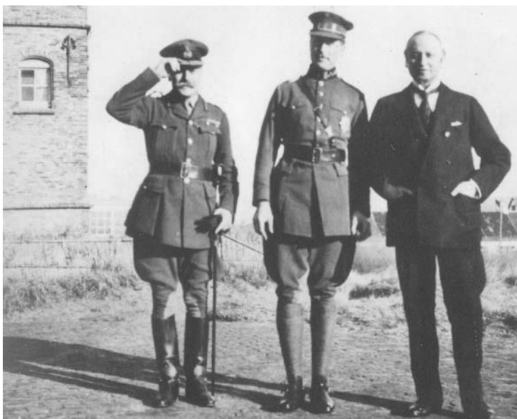
De Britse generaal Haig en lord Curzon, een persoonlijke vriend van Albert, werden op 7 februari 1916 in De Panne ontvangen.

« Aan het oostelijk front wordt de toestand voortdurend slechter. De strijdkrachten