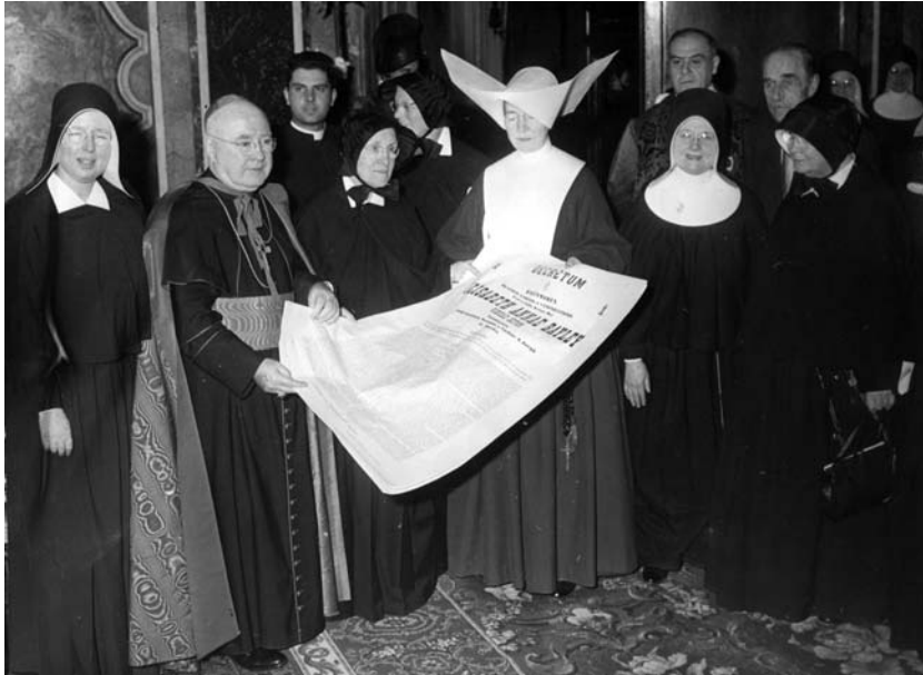
FRANCIS KARDINAAL SPELLMAN (1889-1967)

in Rome op 18 december 1959, met het decreet waarin de heldhaftigheid van de deugden van Elizabeth Ann Bayley Seton werd erkend (zij zou in 1975 de eerste heilige van Amerikaanse geboorte worden).