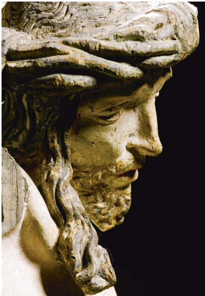
Detail van een kruisbeeld door Tilman Riemenschneider (ca. 1495).

Maar buiten het Kruis is er ook geen goedheid van God meer. God is liefde in het Kruis van Christus. Wie het Kruis echter verwerpt, zal in God enkel een ver-