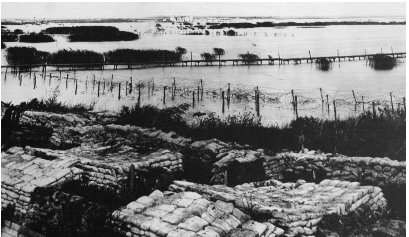
De ondergelopen IJzervlakte in 1916.

Ons land heeft wél iemand "die boven het gewoel staat" : de koning, hoofd van de natie, hoofd van het leger. En Albert weet heel goed wat hij wil, zoals