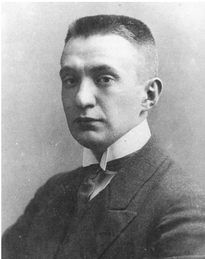
Aleksandr Kerenski, advocaat, getalenteerd redenaar en spilfiguur van de Februarirevolutie. En naïeve wegbereider van de bolsjewistische dictatuur.

Op dat ogenblik had het regime nog gered kunnen worden door een krachtig ingrijpen van de tsaar. Als hij onmiddellijk was teruggekeerd, de Doema had ontbonden en regeringsgetrouwe militairen de straten had laten opkuisen, dan had de revolutie in de kiem gesmoord kunnen worden. Vergeten we niet dat het enkel de hoofdstad was waar er oproer was;