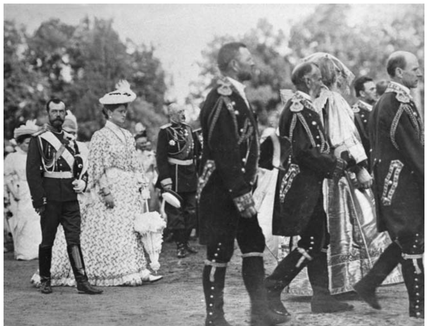
Nicolaas II en Alexandra op het domein van Tsarskoje Selo, met uiterst rechts de Brit Bernard Pares, tijdens de Eerste Wereldoorlog attaché bij het Russisch leger.

De tsarina had de manoeuvres door: « Vergeet nooit », schreef ze aan haar man, « dat je een auto-cratisch keizer bent en dat ook moet blijven. Die verschrikkelijke Rodzjanko [de latere parlamentsvoorzitter] vraagt om de Doema bijeen te roepen. Alsjeblief, doe het niet, het zijn hun zaken niet! Ze moeten weggehouden worden... Goddank is Rusland geen constitutioneel land. Die creaturen proberen een belangrijke rol te spelen. Als men daaraan toegeeft, blazen ze nog hoger van de toren... » (8 juli 1916).