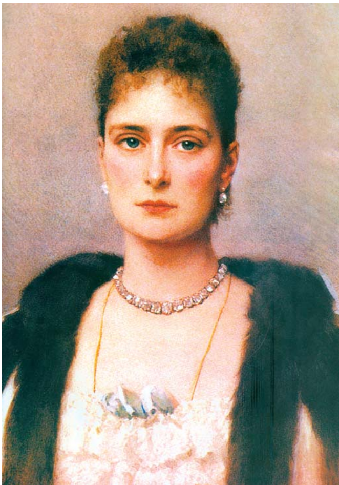
TSARINA ALEXANDRA FEODOROVNA (1872-1918)

De mysterieuze moejik uit Siberië werd in november 1905 voor het eerst aan de tsaar voorgesteld. Hij had toen al de reputatie van een heilig man en een wonderbaar genezer. Twee jaar later werd hij op het paleis ontboden omdat de tsarevitsj, die aan hemofilie leed, een ernstige bloeduitstorting had en de dokters hem niet konden genezen; zijn leven hing aan een zijden draad. « Geloof in de doeltreffendheid van mijn gebeden », zei Raspoetin, « geloof in de macht van mijn tussenkomst en je zoon