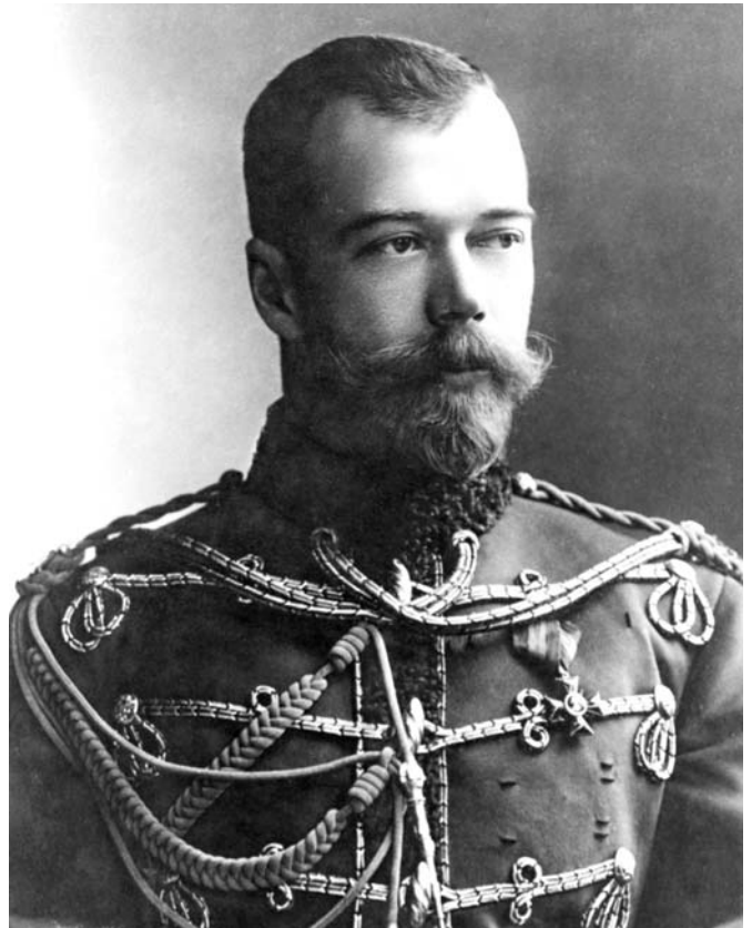
TSAAR NICOLAAS II (1868-1918)