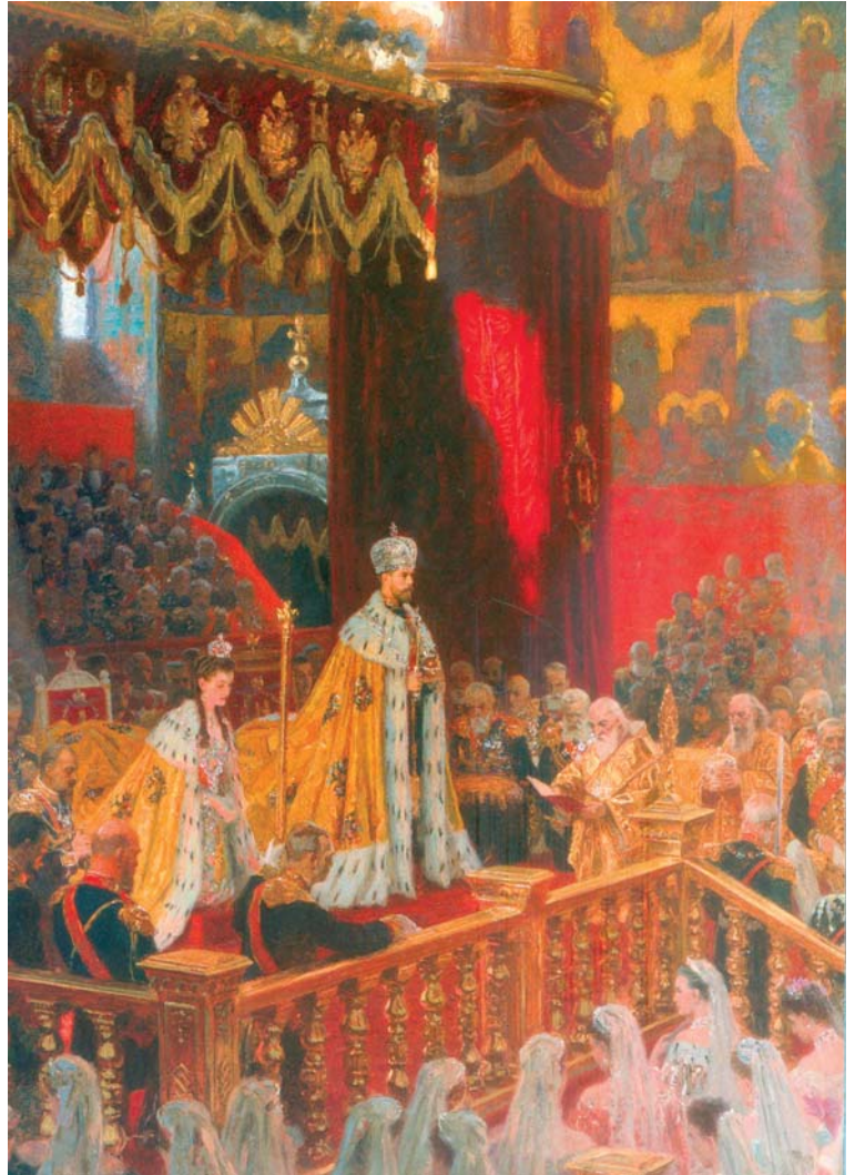
De kroning van Nicolaas II in de kathedraal van de Dormitio in het Kremlin van Moskou, 26 mei 1896. De door God gezalfde tsaar mocht die dag door de heilige deuren van de iconostase tot het altaar naderen om daar onder de twee gedaanten te communiceren.