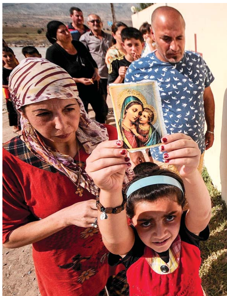
Christelijke vluchtelingen uit Mosoel in Noord-Irak, op de vlucht voor de islamisten, bidden voor hun lotgenoten (2015).

« Dat is verschrikkelijk tragisch. Sinds wij Frans Algerije in de steek gelaten hebben (1 juli 1962), op hetzelfde moment dat Vaticanum II samengeroepen werd (11 oktober 1962), staat in heel de wereld de islam op, met de