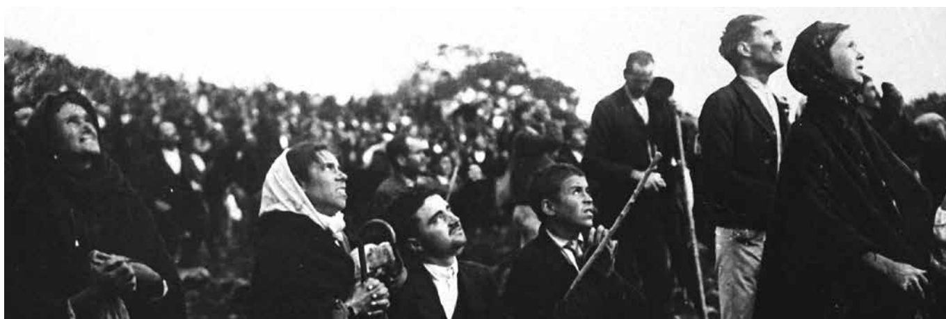
Vijftig- tot zeventigduizend mensen waren getuige van het zonnwonder: « Mirakel! Mirakel!... Een wonder! »

« Wat heb ik op de heidevelden van Fatima gezien dat echt zo vreemd was? De regen die op het vooraf aangekondigde uur plots ophield; de dichte wolkenmassa die verdampte; het koninklijke hemellichaam, een matte, zilveren schijf die in het zenit verscheen en begon te dansen in heftige en »