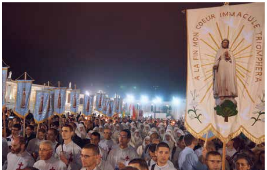
De kaarsenprocessie, luister bijgezet door onze jonge vaandeldragers.