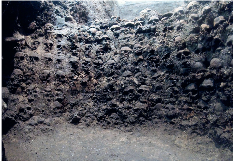
Een deel van de « toren van schedels » die archeologen onlangs opgroeven in Mexico-stad, het oude Tenochtitlan, vlakbij de Templo Mayor .

Een van de Spaanse soldaten die mee optrokken met Cortés was Andrés de Tapia, die ook kroniekschrijver was. Hij maakte een verslag op van alles wat de expeditie meemaakte. In een van de passages van die « Relación » spreekt hij met afschuw over een van de ver-