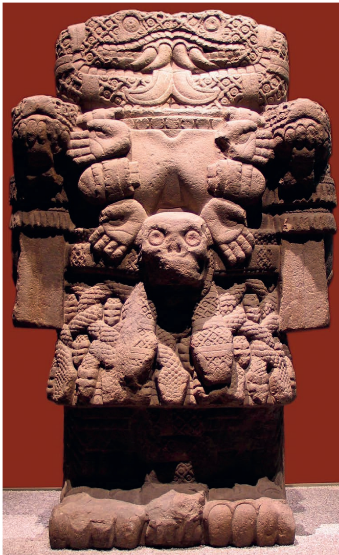
Het hoofd van de Azteekse godin Coatlicue bestaat uit twee slangen die samen een afzichtelijk gelaat vormen ; over haar borst hangt een snoer van afgehakte handen en uitgerukte harten. Een respectabele godsdienst of de heerschappij van Satan ?

schrikkelijkste vondsten die de Spanjaarden in Tenochtitlan deden : « een toren enkel gebouwd van kalk en duizenden schedels, de tanden naar buiten gericht, zonder dat er stenen aan te pas kwamen ».