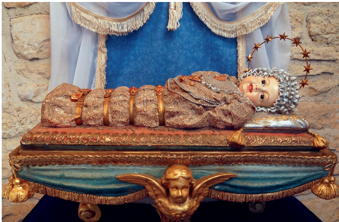
La Santissima Bambina, de H. Maagd Maria als pasgeboren baby. Kopie in de kapel van het Maison Saint-Joseph van een wassen beeld vervaardigd in de 17 de eeuw en bewaard in Milaan.