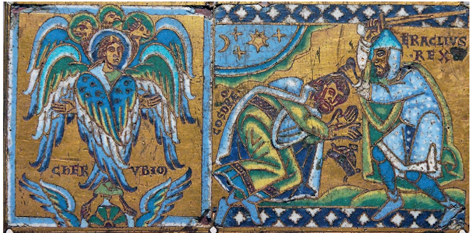
De Byzantijnse keizer Heraclius II verslaat de Perzische grootvorst Chosroës II, terwijl een cherubs toekijkt. Detail van de versiering in email van een kruisbeeld, ca. 1160 (Parijs, Louvre). Deze voorstelling van de slag bij Ninive in 627, hoogtepunt van de langdurige oorlog tussen de Byzantijnen en de Perzen, biedt ons de noodzakelijke historische context om op een wetenschappelijke manier over de opkomst van de islam te spreken.

En wat zegt ons die traditie? Onder meer dat Mohammed geboren is in Mekka. Maar van Mekka is geen spoor te bekennen op de oude landkaarten van het Arabisch schiereiland! De grote specialist Vidal de la Blache stelde al in 1896 een landkaart samen van de handelsroutes in Arabië, op basis van de Griekse geograaf Ptolemaeus (2 de eeuw n. Chr.): Mekka schittert door afwezigheid... Dat stelt meteen het probleem van de plaatsen waar zich de gebeurtenissen rond de stichting van de islam afspeelden.