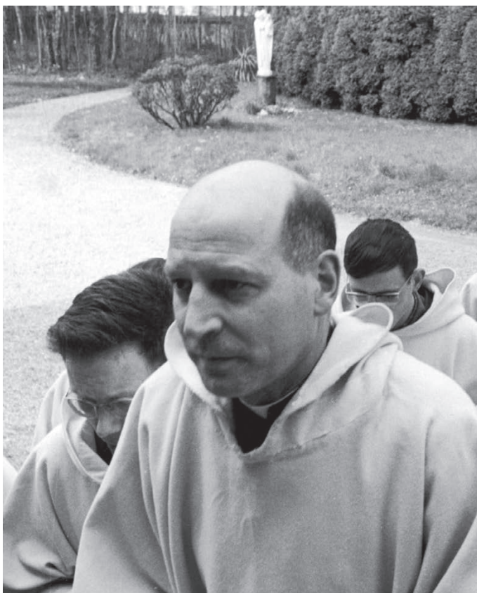
Abbé de Nantes met de eerste broeders van zijn communiteit bij het Maison Saint-Joseph in 1964. Op de achtergrond staat het beeld van Onze-Lieve-Vrouw dat zijn parochianen hem bij zijn gedwongen vertrek geschonken hadden.

Die ongeregelheden waren ook de twijfelachtige connecties tussen de christendemocratie en het communisme, aangeklaagd door abbé de Nantes tijdens een publieke conferentie in 1952. Dat kwam hem te staan op zijn verwijdering uit het bisdom Parijs en het blokkeren van zijn benoeming tot