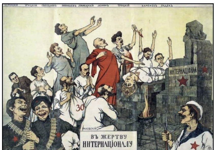
« Een offer aan de Internationale » : de bolsjewistische kopstukken offeren Rusland aan de afgod Karl Marx. Op de bovenste rij van links naar rechts : Kerenski (die zich distantieert, maar de bron van alle ellende is), Oeritski, Sverdlov, Zinovjev, Lenin (als rode hogepriester), Trotski (met het offermes), Kamenev, Radek. Deze propagandaposter van de Witten drukt perfect uit dat de Russische revolutie in wezen een anti-Russische revolutie was.

Bij elke gelegenheid hamert Lenin op de noodzaak van een schrikbewind. Al op 7 december 1917 beslist de Raad van volkscommissarissen tot de oprichting van een « buitengewone commissie voor de strijd tegen de contrarevolutie » : de Tsjeka is geboren. Onder Feliks Dzerzjinski zal zij in korte tijd uitgroeien tot een meedogenloze moordmachine tegen alle « vijanden van de revolutie ». De enige vraag die aan een verdachte gesteld wordt, is tot welke klasse hij behoort. Vanaf januari 1918 is « de doodstraf ter plekke, zonder proces » van kracht. Daarop volgt het oppakken van honderden en weldra duizenden onschuldige « gijzelaars », die midden in de nacht worden gefusilleerd of met hele overzetboten tegelijk in de rivieren verdrinken. Er is