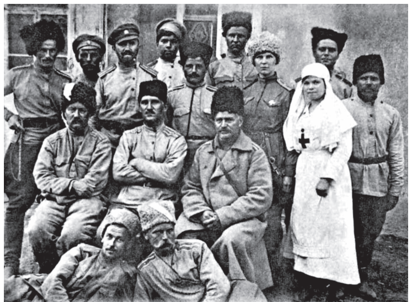
Soldaten en een verpleegster van het Witte Leger op de Krim.

Op 6 april 1920 komt Wrangel aan in Sebastopol. « Ik heb met het leger de roem van de overwinning gedeeld, ik kan nu niet weigeren om met datzelfde leger de kelk te drinken tot de dood toe » (aangehaald in Jevakhoff, p. 622). Hij wil van het schiereiland de basis maken voor een groot offensief... met slechts twintigduizend manschappen. Om de Kozakken aan zich te binden vervangt de baron het «ene,