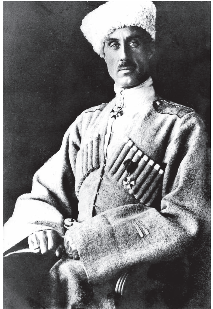
GENERAAL BARON WRANGEL (1878-1928).

Op 19 oktober staat Joedenitsj aan de rand van Petrograd, terwijl de Roden in beslag genomen zijn door de fronten in het oosten en het zuiden. Hij slaagt er echter niet in om de controle te verwerven over de vitale spoorweglijn tussen de vroegere en de nieuwe hoofdstad. De bolsjewieken zien hun kans en sturen massaal versterkingen naar Petrograd, « de eerste stad van de proletarische revolutie » (Trotski). Bovendien worden alle arbeiders, mannen én vrouwen, onder de wapenen geroepen. Eind oktober zijn