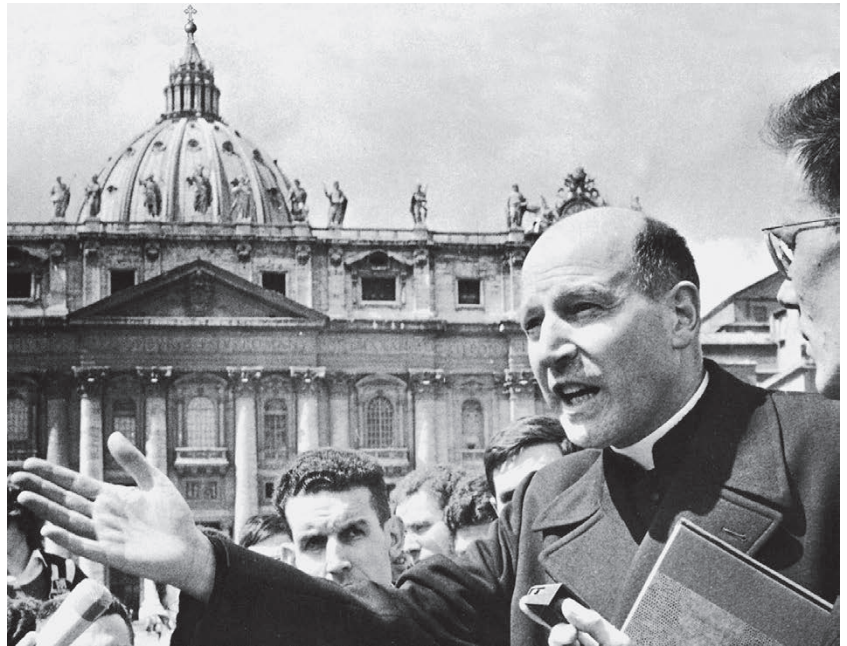
10 april 1973 : abbé de Nantes, vergezeld door zijn broeders en een groep vertegenwoordigers van de Liga voor katholieke Contrareformatie , brengt zijn « Aanklachtenboek » tegen paus Paulus VI naar Rome.

« De goede katholieken worden in de tang genomen door twee verleidingen waartegen zij zich moeten verzetten. Ofwel alles aanvaarden, de chaos en het bederf van de eredienst van het geloof en van de zeden, allemaal bevolen of toegelaten door een eensgezinde hiërarchie waarvan de Paus het hoofd is... Of alles in zijn totaliteit verwerpen, omdat het werkelijk te dwaas en te triest is en teveel kwaad doet, door een Kerk te verlaten