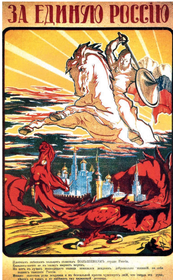
Een affiche uit 1919 die onder de titel « Voor het ene Rusland » weergeeft hoe de Witten hun strijd zagen: een gevecht op leven en dood met de draak van het bolsjewisme.

handen van de bolsjewieken. Anders dan de communistische mythe het later zal voorstellen, heeft de fameuze kruiser Aurora slechts één schot in de lucht gelost, want de ligging van het schip stond niet toe dat zijn kanonnen het paleis konden viseren. Het kaartenhuis van Februari valt zonder slag of stoot omver.