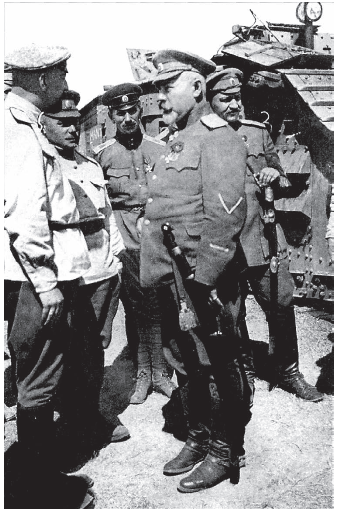
GENERAAL DENIKIN (1872-1947).