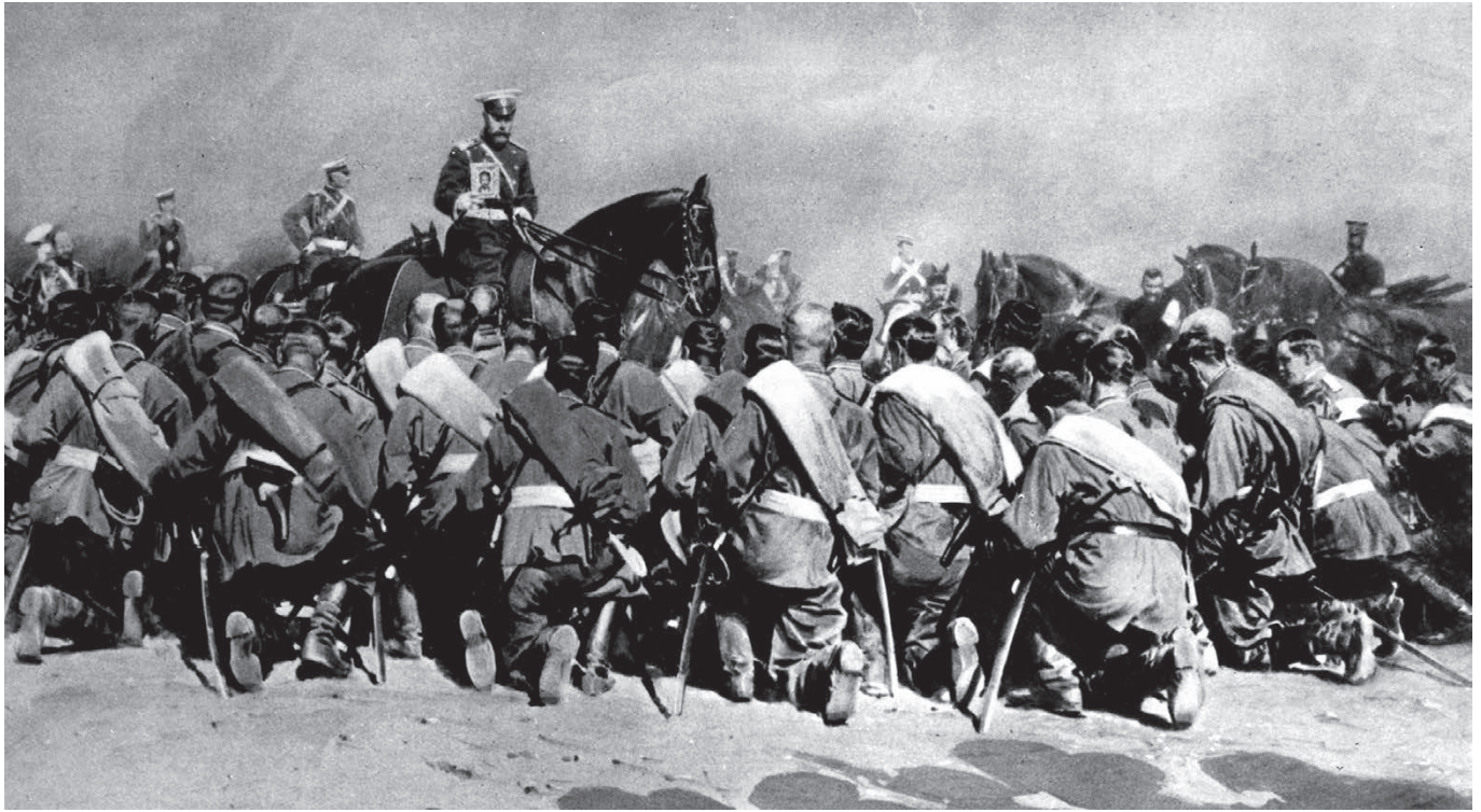
TSAAR NICOLAAS II ZEGENT ZIJN SOLDATEN MET EEN HEILIGE ICOON (1916).

Eeuwenlang was de autocraat de gewijde Plaatsvervanger van God op Russische grond. Na zijn gedwongen aftreden, het resultaat van een samenzwering binnen de liberaalgezinde hogere klassen, begon voor Rusland de afdaling ter helle.