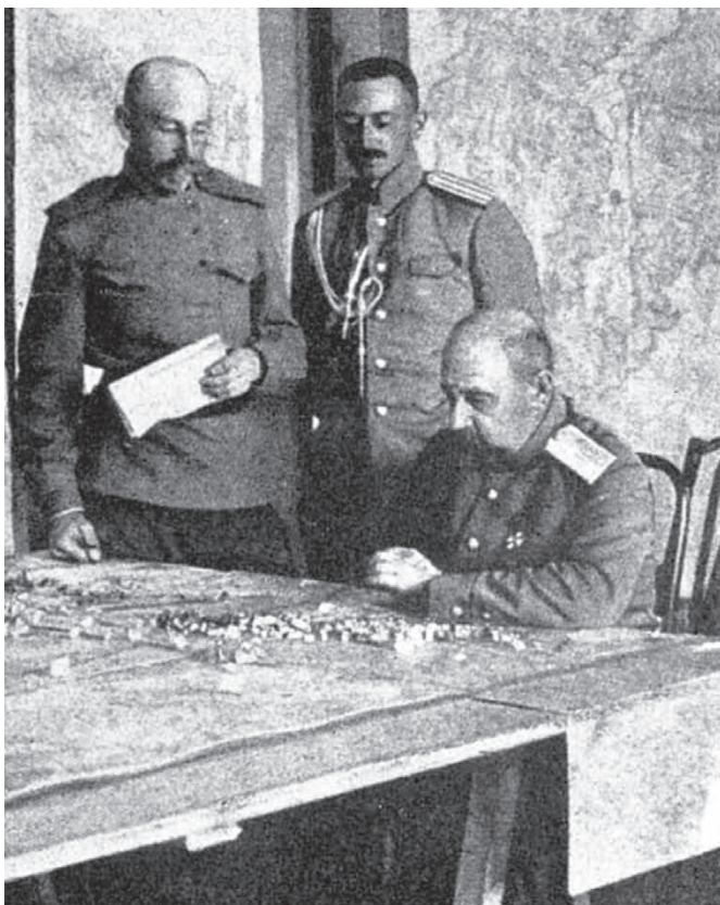
GENERAAL JOEDENITSJ (1862-1933).

In DE WITTE ADMIRAAL wordt die laag-bij-de-grondse Realpolitik treffend weergegeven in de woorden