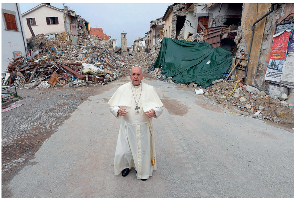
Amatrice, 4 oktober 2016: paus Franciscus trekt « wankelend, door pijn en verdriet terneergeslagen, door een grote stad die voor de helft verwoest is » (derde Geheim). De dramatische gelaatsuitdrukking van de H. Vader maakt duidelijk hoe hij lijdt onder de rampen die de wereld treffen. Maar zijn oplossingen zijn helaas niet de juiste.

Toen Franciscus op 16 januari in Chili aankwam, drukte hij tegenover de presidente, Michelle Bachelet, zijn voldoening uit over de aansluiting van het Zuid-Amerikaanse land bij die « Beweging »: « Chili werd de afgelopen decennia gekenmerkt door de ontwikkeling van een democratie die gezorgd heeft voor een volgehouden vooruitgang. » Onder verzwegen: dankzij de omverwerping van generaal Pinochet. « De recente verkiezingen waren een