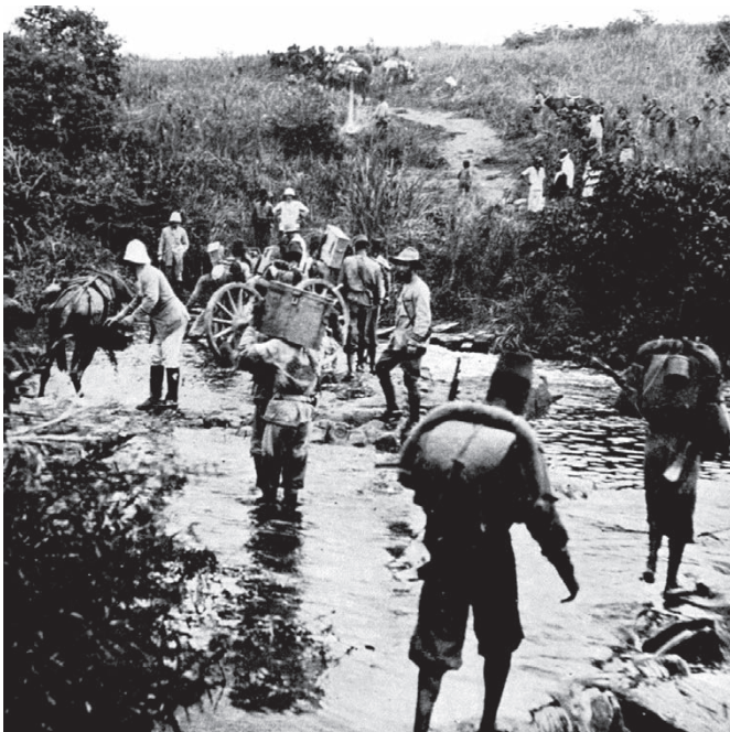
De Weermacht op campagne tijdens de Eerste Wereldoorlog.