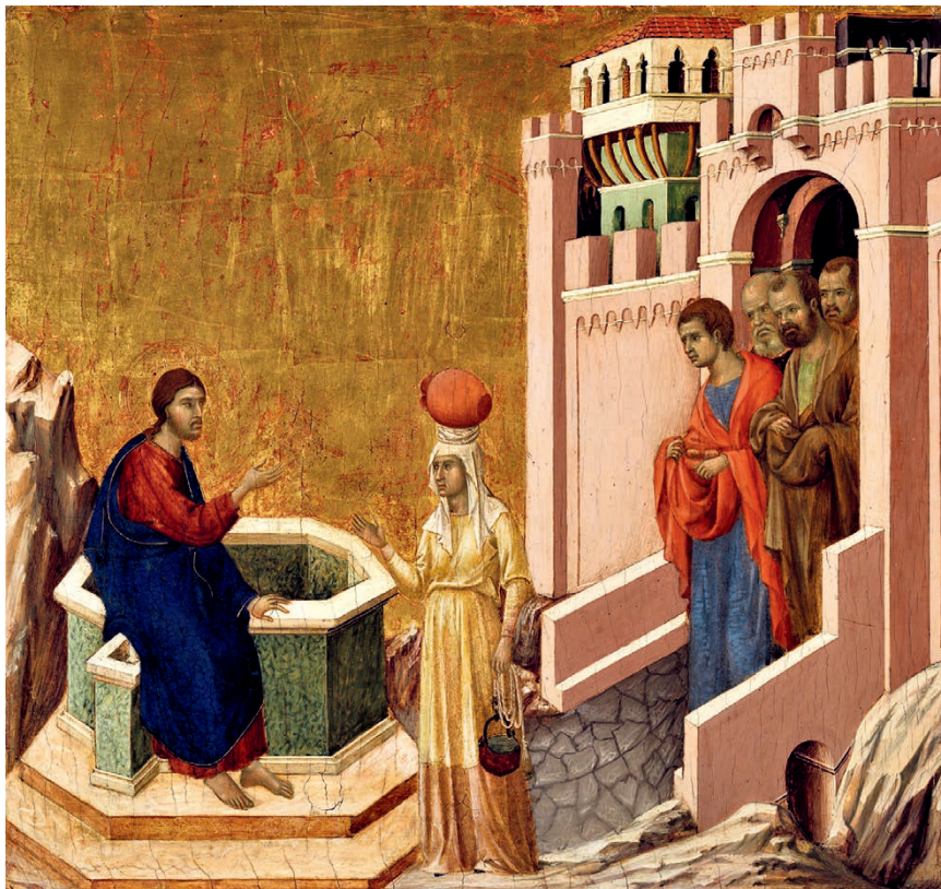
JEZUS EN DE SAMARITAANSE VROUW.

20 Het onbe- grip van de on- derzoekers is zo groot – en heel begrijpelijk – dat zij met verstom- ming geslagen zijn. « Zesenvet- tig jaar heeft men aan deze Tempel gewerkt en zult Gij hem in drie dagen heropbou- wen? » Het mi- rakerel dat Jezus hier aankondigt als teken van zijn zending om het huis van zijn Va- der te zuiveren, kan door de Jo- den niet begre- pen worden. Het is een raadsel, een misverstand, maar van zijn