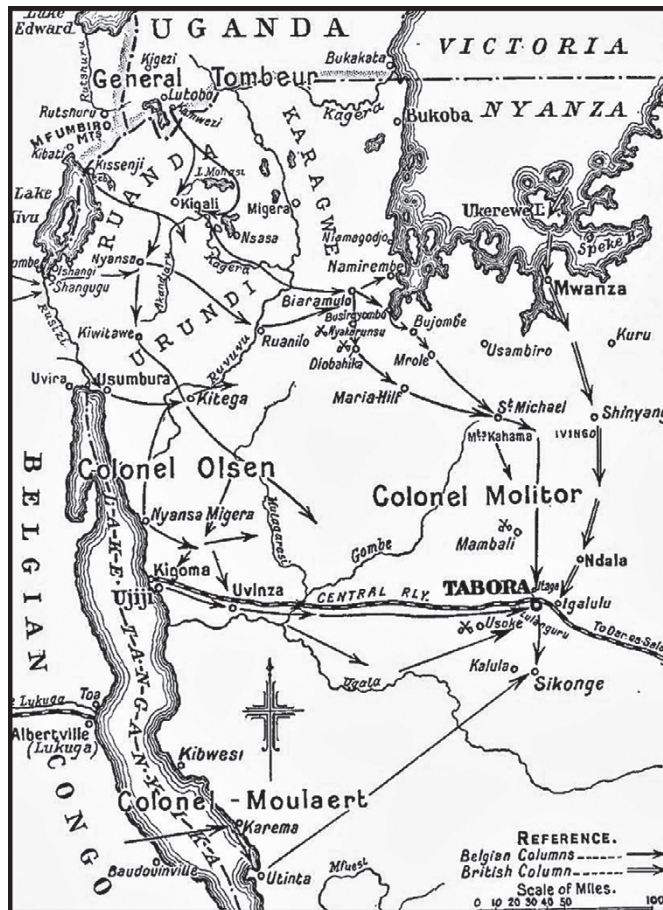
De veldtocht van Tabora, een groot militair succes voor het Belgisch-Congolese leger.

Ondertussen schrijven Belgische piloten nog een ander exploit op hun naam. De onderdelen van vier watervliegtuigen van het type Short 827 worden vanuit Europa overzee naar Matadi vervoerd. Vervolgens worden ze getransporteerd over een afstand van 2000 km, langs de spoorweg en over land, tot aan het Tanganyikameer, waar ze aankomen in mei 1916. Een maand later zien de Duitsers tot hun ontzetting vliegtuigen boven het meer, iets wat ze helemaal niet verwacht hadden in het hart van Afrika. De Graf von Götzen , waarvan de kanonnen door hun beperkte hoek niet naar overvliegende objecten kunnen schieten,