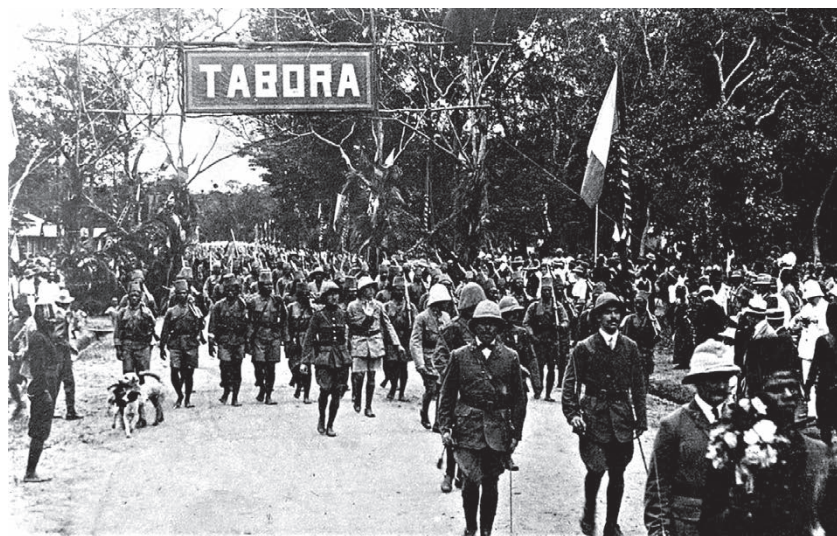
De triomfantelijke intocht van de Weermacht in Tabora op 19 september 1916.