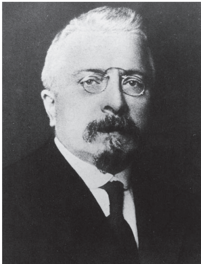
De katholieke politicus Jules Renkin, minister van Koloniën van 1908 tot 1918.

Duitsland , dat zich stevig had ingeplant ten oosten van het Tanganyikameer (Duits-Oost-Afrika, het huidige Tanzania), loerde naar uitbreiding in westelijke richting. Al in 1894 hadden Duitsers en Britten een akkoord gesloten om België te dwingen tot een territoriale "correctie" ter hoogte van het Kivumeer, waaruit Berlijn later voordeel hoopte te halen. In uitvoering van het akkoord rukten Britse troepen in 1909 op naar de streek Ufumbiro, Belgisch bezit, om het gebied in te palmen. De