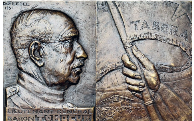
Bronzen herdenkingsplaquette voor generaal Charles Tombeur, die de succesvolle veldtocht van Tabora tegen het Duitse koloniale leger (1916) op zijn palmares mocht schrijven.

Zoals met de Vrijstaat het geval was, blijft de kolonie op financieel vlak volledig gescheiden van het moederland. Congo heft eigen belastingen op import en export, een personenbelasting op elke volwassen mannelijke autochtoon en taksen op de inkomsten van de blanke koloniale en de bedrij-