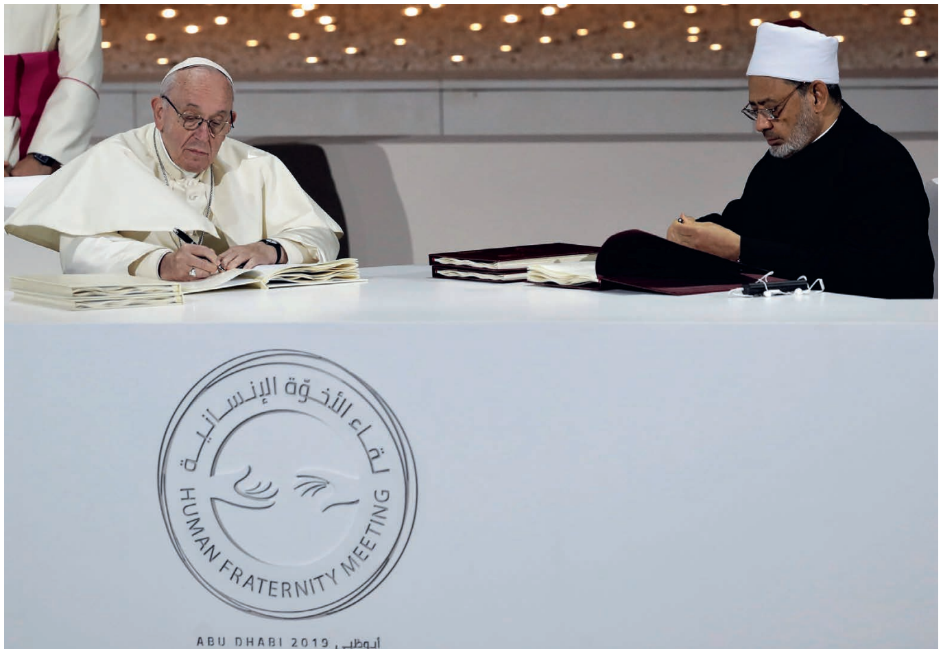
DE PAUS EN DE GROOTIMAM VAN AL-AZHAR

Waarom heeft de paus in Abu Dhabi niet gesproken over Onze-Lieve-Vrouw van Fatima? Haar naam alleen al zou een gevoelige snaar geraakt hebben bij zijn mohammedaanse gastheren. En hij zou er het Onbevlekt Hart mee gemobiliseerd hebben om hen de genade van de Moeder Gods te schenken. Helaas! De aandacht van Franciscus ging vooral naar de ondertekening van een verklaring: het