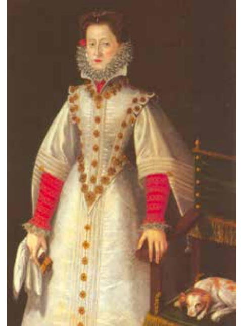
Prinses Polyxena van Lobkowitz (1566-1642), een diepgelovige vrouw en een vurige verdedigster van de katholieke en keizerlijke zaak, schonk het wonderbare beeldje aan het klooster.

Naam Jezus, droeg de prior de eerste mis op het nieuwe altaar op.