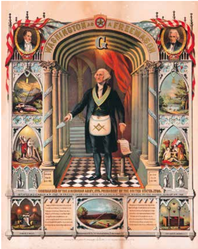
George Washington, de eerste president van de Verenigde Staten, als vrijmetselaar. Hij werd ingewijd in de loge van Fredericksburg in 1752. Linksboven markies de La Fayette, de Franse logebroeder die de maçonnieke idealen in Amerika propageerde; rechtsboven president Andrew Jackson, grootmeester van de loge van Tennessee.

serland, Luxemburg, België, Nederland, Hongarije, Egypte, Latijns-Amerika) en zij die blijk gaven van een zekere godsdienstige en sociale behoudsgezindheid (Groot-Brittannië, Pruisen, de Scandinavische landen, gedeeltelijk Noord-Amerika).