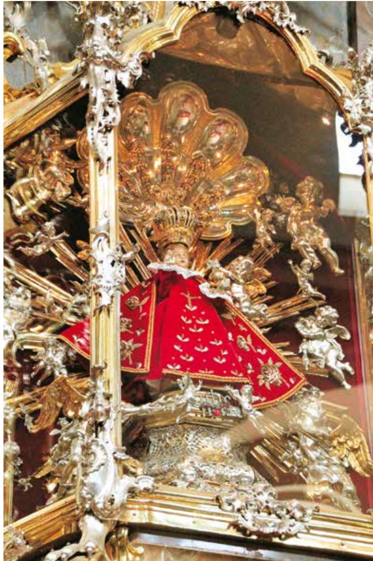
Het Kindje Jezus in zijn barokaltaar uit 1776. « Hoe meer je mij vereert, hoe meer gunsten ik je zal verlenen. »

De hertog van Beieren was er zich bewust van