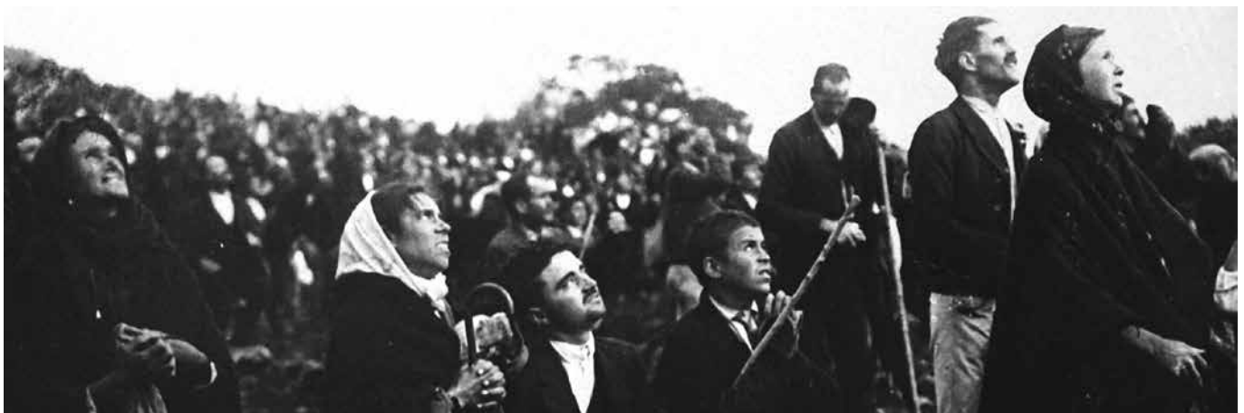
Vijftig- tot zeventigduizend mensen waren getuige van het zonnwonder: « Mirakel! Mirakel!... Een wonder! »

« Wat heb ik op de heidevelden van Fatima gezien dat echt zo vreemd was? De regen die op het vooraf aangekondigde uur plots ophield; de dichte wolkenmassa die verdampte; het koninklijke hemellichaam, een matte, zilveren schijf die in het zenit verscheen en begon te dansen in heftige en