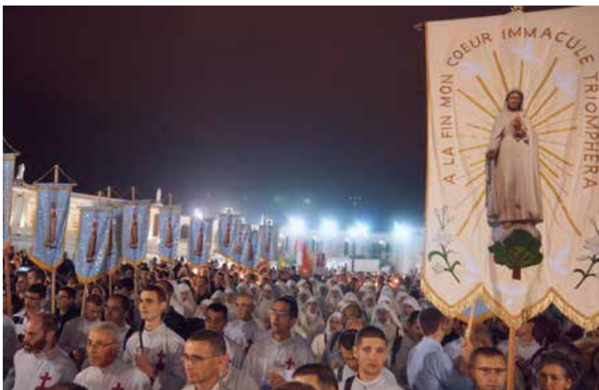
De kaarsenprocessie, luister bijgezet door onze jonge vaandeldragers.