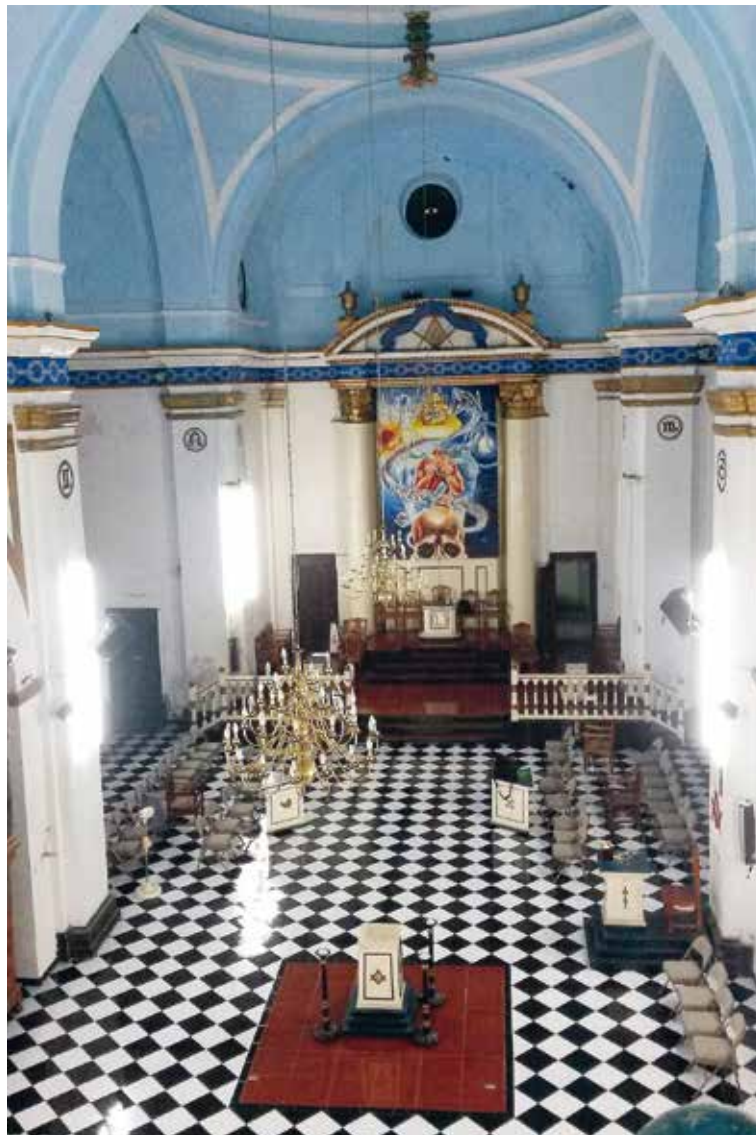
Interieur van de maçonnieke tempel van Veracruz (Mexico). De gelijkenis met een kerkgebouw is frappant en dat is geen toeval : in de loge gaat het ten diepste óók om een eredienst, maar niet die van God.

Eerst en vooral is de loge een samenraapsel van individuen die toegetreden zijn uit arrivisme , met de bedoeling hulp te krijgen bij het straffe-