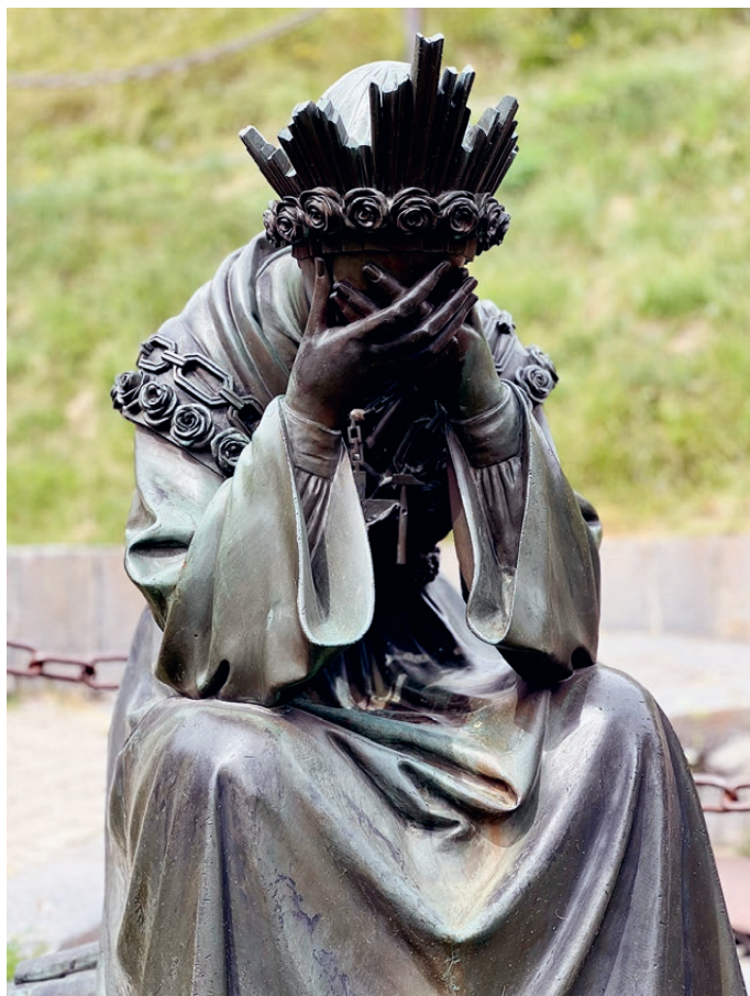
Op 19 september 1846 verscheen in La Salette, in de Franse Alpen, «een mooie Dame» aan de herdertjes Mélanie en Maximin. «Haar houding was er een van ontroostbaar verdriet, het hoofd in de handen en de ellebogen op de knieën...»

Net als in 2023 werd de synode voorafgegaan door een meerdaagse “geestelijke retraite”, « opdat de deelnemers zich zouden openstellen voor de geest van de synode ». Retraite of indoctrinatie? Predikant van dienst was opnieuw de dominicaan Timothy Radcliffe, « een controversiële Britse theoloog die in het publiek de leer van de Kerk over homoseksualiteit heeft tegengesproken » (NATIONAL CATHOLIC REGISTER, 27 januari 2023). Radcliffe heeft geschreven dat de homoseksuele « verlangens » net zoals alle verlangens « door God geschonken zijn » en dat men erin moet « opgevoed » worden in plaats van ze te ontkennen. Verder is hij voor de wijding van gehuwde mannen tot priester en voor het diaconaat van vrouwen. Allemaal standpunten die hem blijkbaar in aanmerking doen komen om kardinaal gecreëerd te worden, wat Fran-