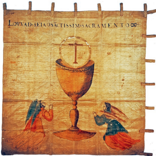
De strijdbanier van de katholieke samoerai Amakusa Shiro, die hij ontvouwde tijdens de Shimabara-opstand. In oud-Portugees staat er: "Lovvado seia o Sactissimo Sacramento", "Geprezen zij het Allerheiligste Sacrament."

ste reis naar Japan in 1579-1582. Toen hij van enkele slechts oppervlakkig gekerstende landheren vernam dat de missionarissen geen respect opbrachten voor de Japanse cultuur en haar « geraffineerde gebruiken » [sic] en dat zij zelfs shintoïstische tempels lieten afbreken, besloot hij een nieuwe werkwijze in te voeren : er moest voortaan ingezet worden op aanpassing van het christendom aan de zeden en gewoonten van de Japanse elite. De fameuze inculturatie !