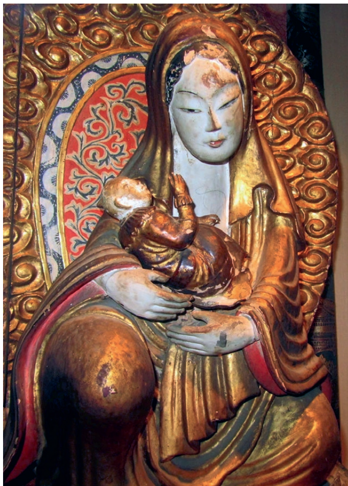
MARIA KANNON MET KIND UIT DE EDOPERIODE.

« Verre van de Japanse cultuur te bewonderen, be- schouwde Franciscus Xaverius haar als een geweldige hinderpaal voor de kerstening : “ Als arme en ellendige vreemdelingen moeten wij rivaliseren met de reputatie en de roem van een trotse natie, die vol bewondering is voor zichzelf en haar geschiedenis en die helemaal gedomineerd wordt door de bonzen, de meest voor- aanstaande personages van het land ” » (art. cit.). Zijn