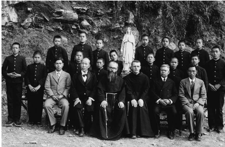
Pater Kolbe in de "Tuin van de Onbevleete" in Nagasaki, 1936.

De geestelijken vestigen zich in een klein en armzalig huis. Voor de stichting van de nieuwe "Stad van de Onbevleete" kan pater Kolbe slechts een terrein in de voorsteden van Nagasaki verwer-