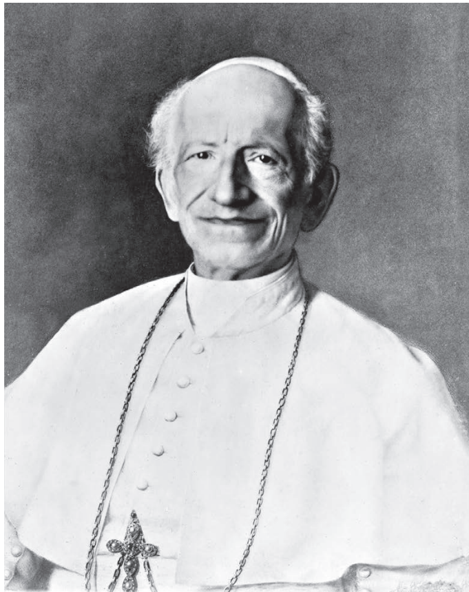
PAUS LEO XIII, een liberaal-katholiek op de H. Stoel.

Op 10 juni 1884 leed links een zware nederlaag. De katholieke partij verwierf in de Kamer een meerderheid van 34 zetels. De opluchting onder de gelovigen was zo groot dat in heel het land de klokken werden geluid. De katholieken zouden nu dertig jaar lang alleen regeren en de liberale partij zou er nooit meer in slagen zonder coalitiepartner een regering te vormen.