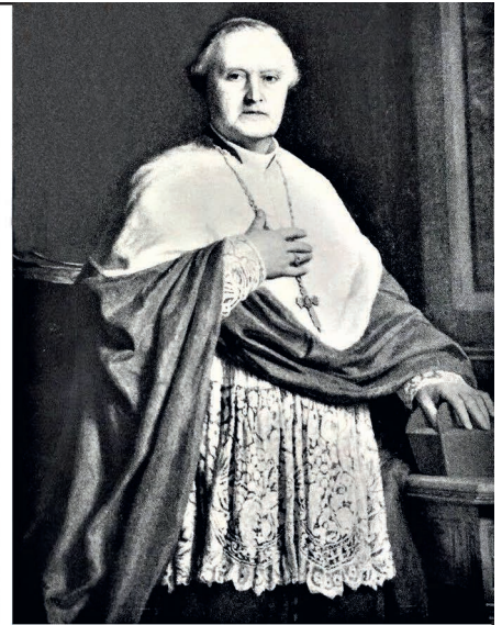
Kardinaal DECHAMPS aartsbisschop van Mechelen

bestuur kon men zelfs niet spreken over een "correctie". De wet was er vaak vervalst met betrekking tot het godsdienstonderricht, zodat men zei: « In de steden zou de herziening van de wet van 1842 weinig veranderen aan de praktijk. »