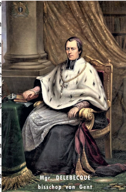
Mgr. DELEBEQUE bisschop van Gent

Vanaf 1859 legde het ministerie zich toe op het « administratief corrigeren » van de wet uit 1842. Men belette bv. zoveel mogelijk de adoptie van katholieke privéscholen en de keuze van de onderwijzers gebeurde in een geest die de Kerk duidelijk vijandig gezind was. Voor de steden met een liberaal