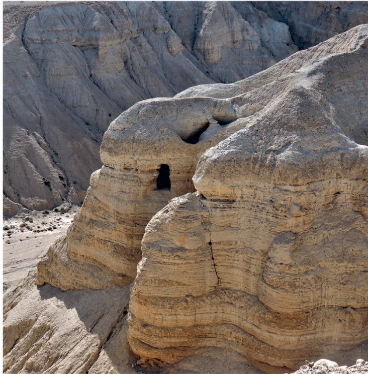
DE GROTTEN VAN QUMRÂN waar de Essenen hun geschriften verborgen.

25 Ze doen alsof ze Hem niet begrijpen, alsof Jezus zijn zin niet afgemaakt heeft door “IK BEN” te zeggen : “Gijzelf, wie zijt Gij dan ?”