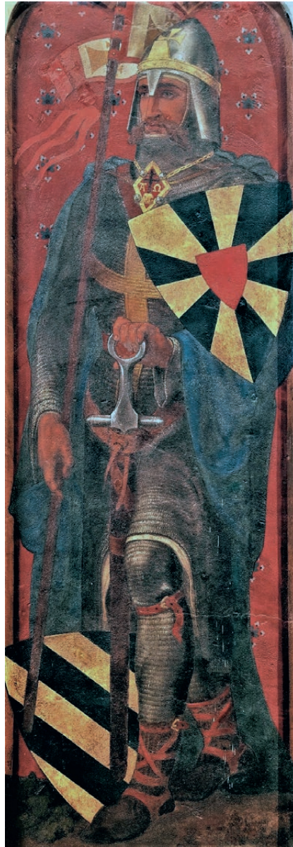
PORTRET VAN ROBRECHT II

De strijd om Arqa draaide uit op een fiasco voor de Zuid-Franse graaf, die Robrecht en Godfried zelfs ter hulp moest roepen om zijn hachje te redden. Vooral Godfried maakte zich erg boos en dwong de graaf om de belegering op te geven en zich op Jeruzalem te concentreren. Zowel Luyckx als