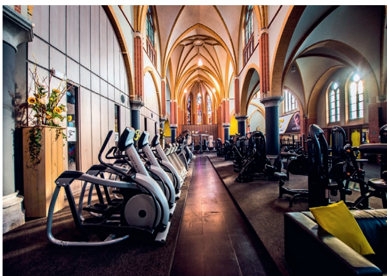
De Sint-Willibrorduskerk in Zeilberg (Deurne, Nederland) is vandaag een fitnesscentrum.

De provincie Antwerpen stelde een beleidsplan op voor de jaren 2020-2024. « KERKPLUS » wil in nauwe samenwerking met gemeentebesturen, kerkraden en de bisschoppelijke overheid een toekomst uittekenen voor de 298 katholieke kerken die de provincie rijk is. Ongeveer een derde daarvan komt in aanmerking voor « neven- of herbestemming », een pro-