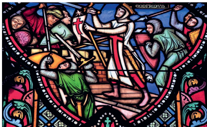
Glasraam met voorstelling van de verovering van Jeruzalem in 1099. Godfried van Bouillon werd dé held van de eerste kruistocht, maar de Vlaamse graaf Robrecht II moest voor hem niet onderdoen inzake vroomheid en vurigheid. Beide figuren zijn de incarnatie bij uitstek van het christelijke ridderideaal.

In het christelijke Westen reageerde men ontzet en verontwaardigd. Toen paus Urbanus II op het concilie van Clermont in 1095 de christenheid opriep om het H. Land en de plaatsen waar Jezus geleefd en geleden had te bevrijden, kon hij dan ook op groot enthousiasme rekenen: « God wil het ! »