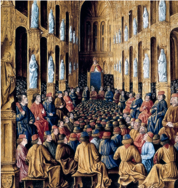
Op het concilie van Clermont in 1095 riep paus Urbanus II de christenheid op om het H. Graf in Jeruzalem te bevrijden. Zijn oproep zou het aanschijn van de middeleeuwse wereld diepgaand veranderen.

hartelijk werd onthaald door zijn zus, die met de plaatselijke hertog gehuwd was. Die laatste bood de graaf kostbare geschenken aan, maar de godvruchtige Robrecht weigerde ze beleefd en verkoos in het bezit te worden gesteld van enkele belangrijke relikwieën, die hij aan zijn echtgenote liet bezorgen om er de nieuwe abdijkerk van Waten ( Watten ) mee te verrijken.