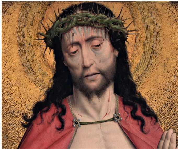
« ECCE HOMO »

38-39 Na deze woorden ging hij naar de Joden terug en sprak tot hen : “Ik vind volstrekt geen schuld in Hem. Maar gij hebt een gewoonterecht, dat ik u iemand vrijlaat bij gelegenheid van het paasfeest. Wilt gij dus dat ik u de Koning der Joden vrijlaat ?” Pilatus wordt