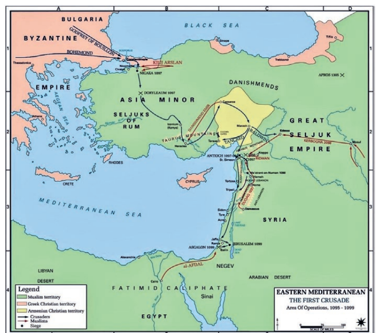
HET VERLOOP VAN DE EERSTE KRUISTOCHT (1096-1099)

In mei 1097 staken de kruisvaarders de Bosporus over in de richting van hun eerste doel: de stad Nicaea, machtsbasis van de Seltsjoekse sultan Kilij Arslan. Zij omsingelden de stad en belegerden haar een maand lang, waarbij een Turkse aanval slechts ten koste van zware verliezen kon afgeslagen worden. Op het moment dat de overgave van Nicaea nakend was, sloten afgezanten van de basileus in