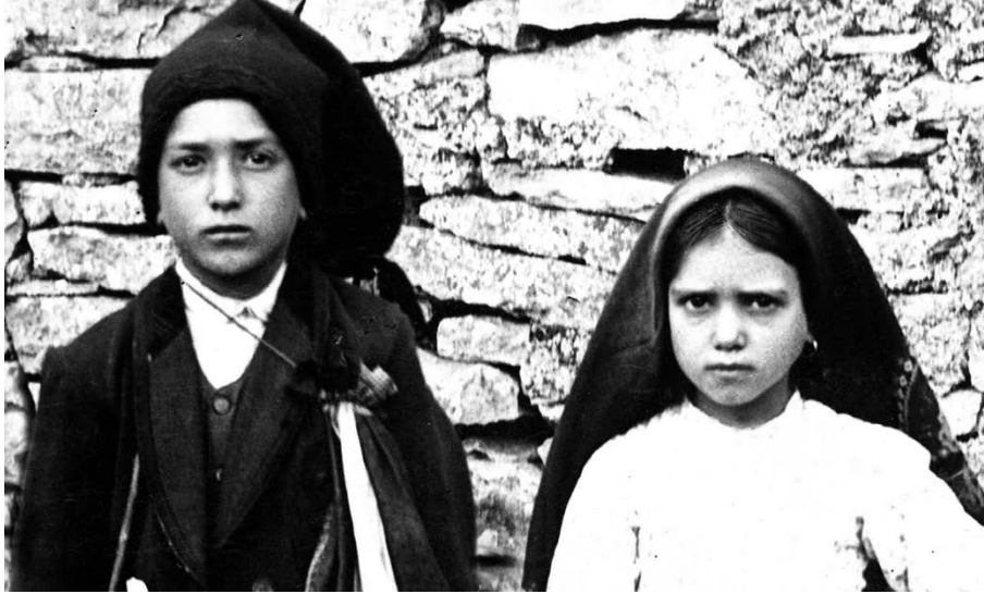
DE H. FRANCISCO EN DE H. JACINTA, « Zo klein... en toch zo groot ! »

Het immense geluk dat de zieke zienster verklaarde te putten in de beschouwing van Christus op het Kruis, ondersteunde haar gedurende heel het laatste jaar van haar leven. Dat laatste jaar was haar lijden zo intens dat ze de nachten doorbracht zonder te kunnen slapen. En als ze dan toch enkele ogenblikken induttede, maakte een nog heviger pijn haar wakker. Het gebeurde dan dat ze uiting gaf aan dat lijden, maar onmiddellijk vroeg