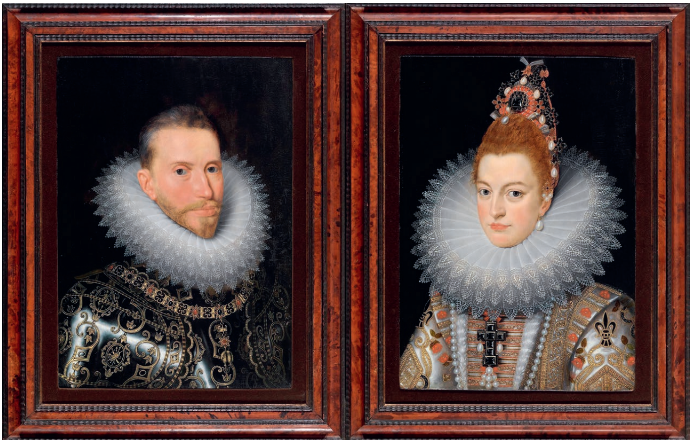
De aartshertogen Albrecht en Isabella bekampen moedig het gevaar dat uitging van de calvinistische Republiek van de Verenigde Provinciën en waren tegelijkertijd de steunpilaren van de katholieke renaissance in de Zuidelijke Nederlanden.

Lenaart Leys of Lessius (1554-1623) werd geboren in de Kempense gemeente Brecht. Al snel merkte men zijn grote scherpzinnigheid op, waardoor hij met een