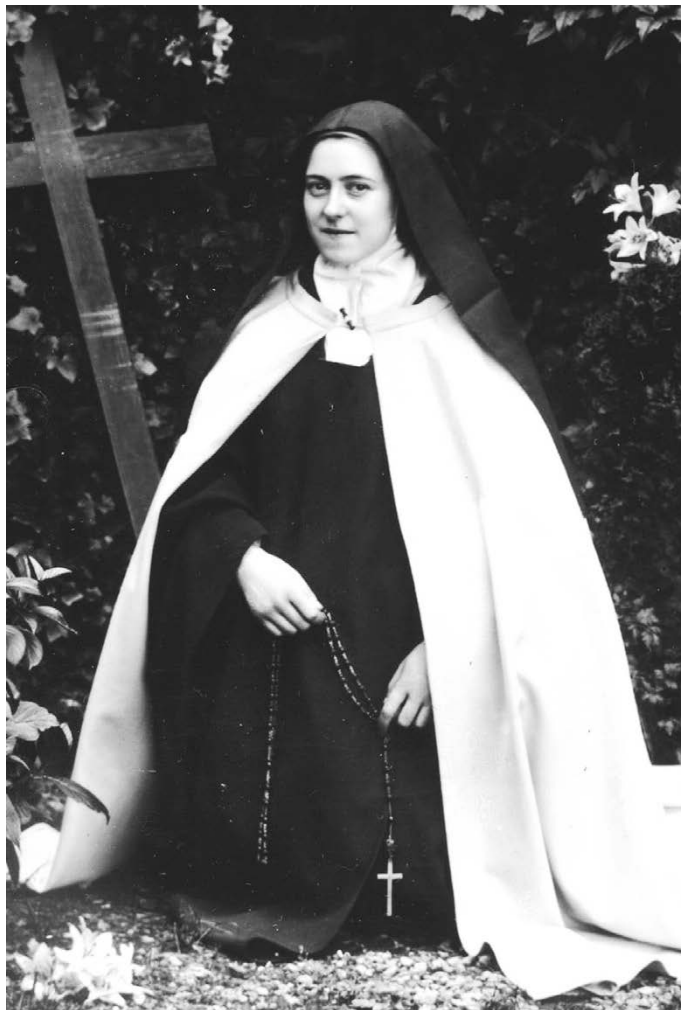
DE H. TERESIA VAN LISIEUX (1873-1997) : « In het hart van de Kerk zal ik de Liefde zijn. »

« Het is in deze Kerk dat wij onze redding kunnen bewerken, hoe moeilijk dat tegenwoordig ook lijkt. Maar een mystieke ziel zoals de H. Teresia van Lisieux, die allicht in rustiger tijden leefde dan