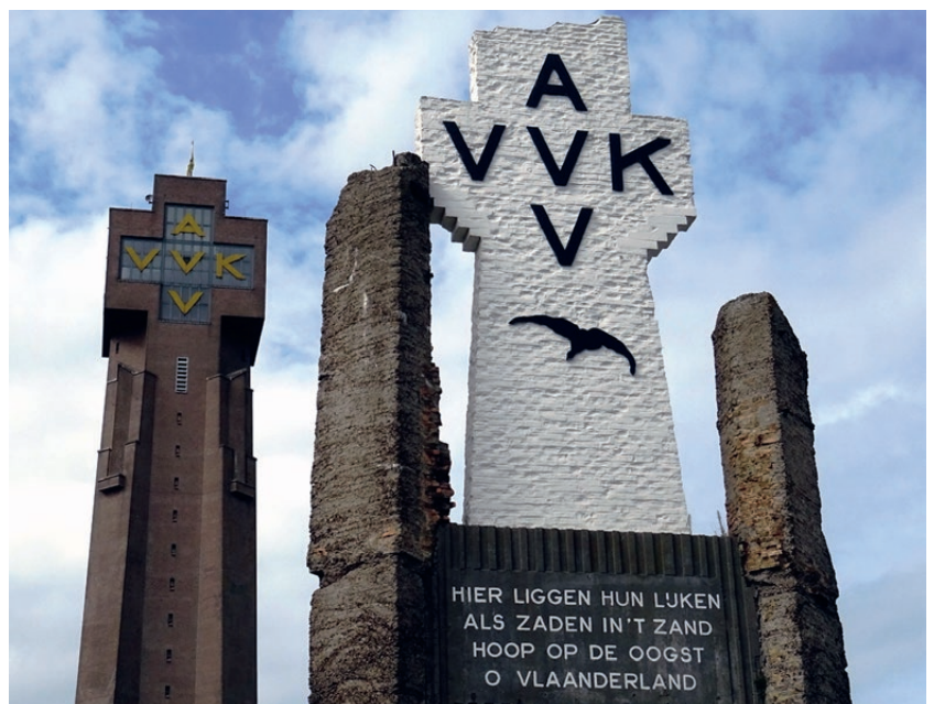
« Alles voor Vlaanderen, Vlaanderen voor Christus » : de indrukwekkende leuze op de IJzertoren in Kaaskerke bij Diksmuide.