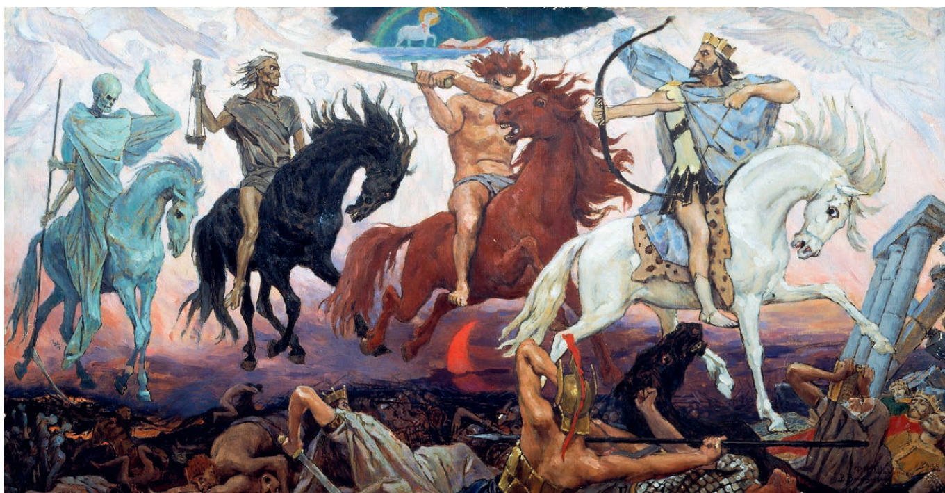
DE VIER RUITERS VAN DE APOCALYPS

De Britten van hun kant verslikten zich in hun thee toen ze vernamen dat Sir Patrick Sanders, hoofd van de generale staf, op een militaire conferentie eind januari het Britse volk een « prewar generation » genoemd had en opgeroepen had tot een vorm van nationale dienstplicht : « De beroeps-legers beginnen de oorlogen, de burgerlegers winnen ze. » En dan was er natuurlijk ook de Franse president Macron, die op 26 februari tegenover de pers verklaarde : « De hypothese van het sturen van westerse troepen naar Oekraïne kan niet uitgesloten worden. » Onder verzwegen : om de onvermijdelijke opmars van het Russische leger zo lang mogelijk tegen te houden.