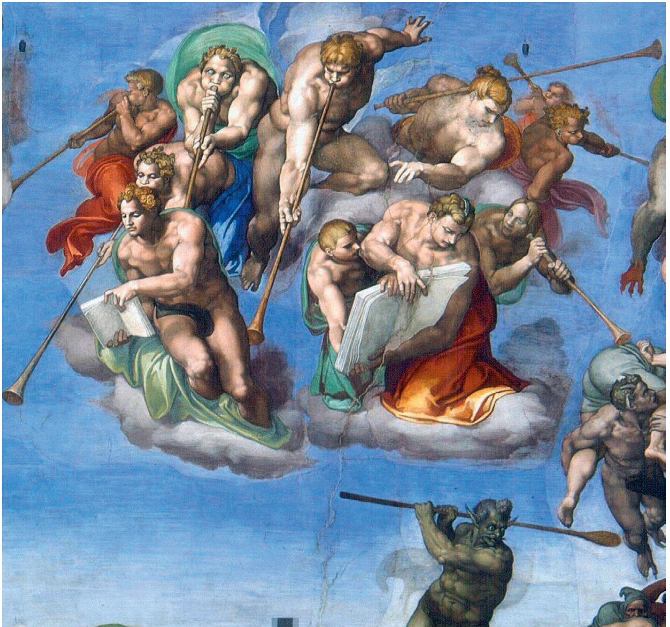
HET BAZUINGESCHAL VAN HET LAATSTE OORDEEL, detail van Michelangelo's fresco in de Sixtijnse kapel

Er gaat dus eerst iemand Anders komen dan Jezus. Op de dag van Pinksteren begint de tijd van de H. Geest. En als we de H. Schrift goed lezen, stellen we vast dat de tijd na Pinksteren waarschijnlijk lang zal duren. Waarom ? Omdat de apostelen gedurende die periode de Blijde Boodschap moeten verkondigen aan alle schepselen, aan alle volkeren, en daar is tijd voor