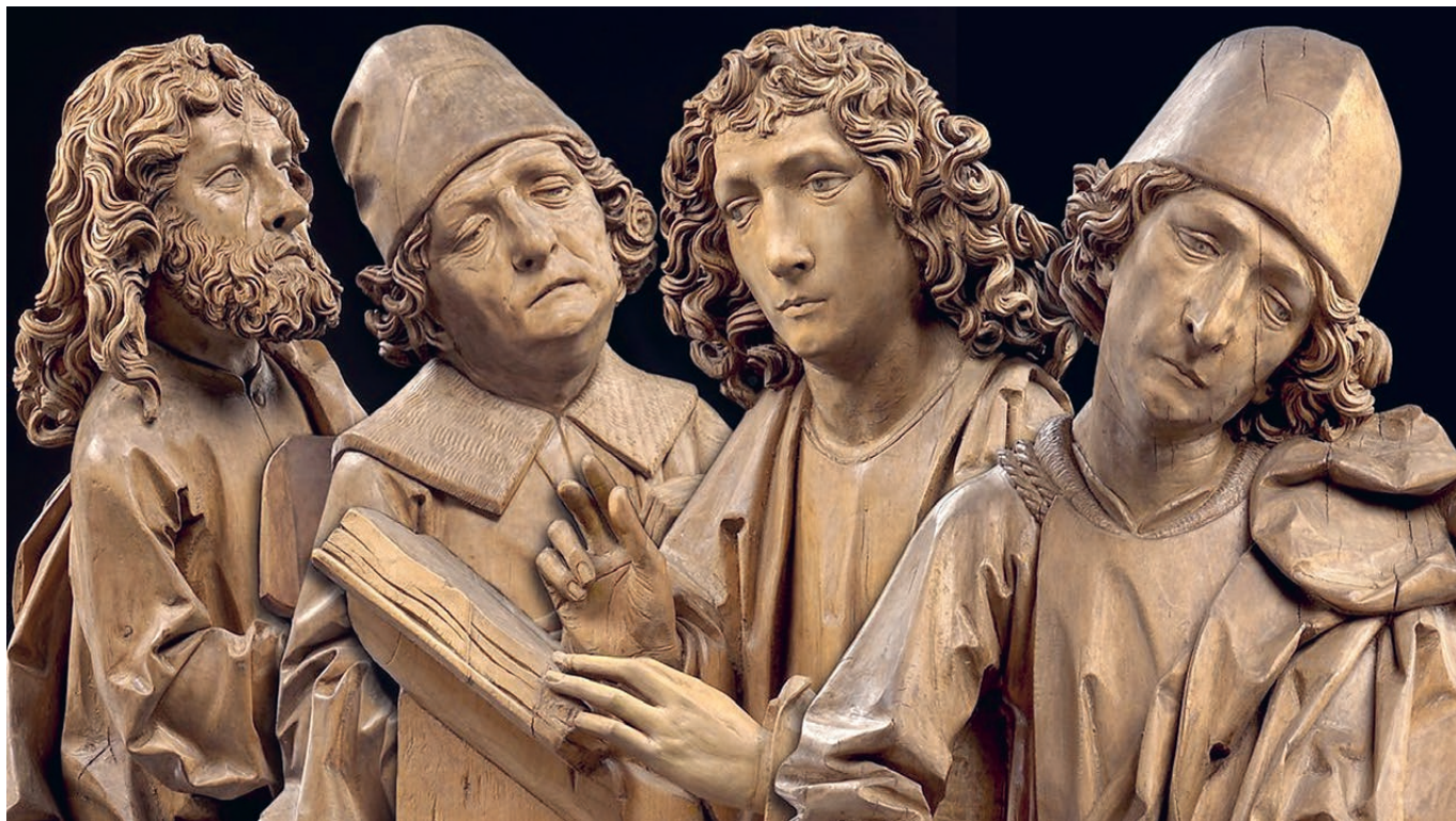
DE EVANGELISTEN MATTHEÛS, MARCUS, JOHANNES EN LUCAS.

Het is zo mysterieus, zo in strijd met de menselijke wijsheid, dat de apostelen zelf op een bepaald ogenblik het geloof verloren. Het is waar dat Hij opstond uit de dood, maar zodra het bewijs van zijn verrijzenis was gegeven, keerde Hij snel terug naar de Hemel vanwaar Hij kwam en liet Hij op aarde een handjevol mensen achter zonder de kracht of de moed om zijn koninkrijk in de wereld te vestigen. Zij waren pas in staat om aan deze taak te beginnen na de gawe van de H. Geest, te beginnen met de H. Petrus, die op de dag van Pinksteren tegen de Joden zei: « Jezus van Nazareth, een man voor wie God bij u heeft getuigd door krachten en wonderen en tekenen [...], hebt gij overgeleverd en door de hand van heidenen aan het kruis geslagen en gedood; maar God heeft Hem opgewekt en verbroken de strikken van de dood » (Hd 2, 22-24).