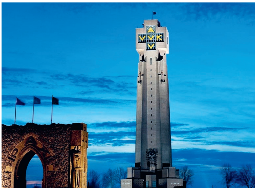
De IJzertoren, heropgericht vanaf 1952, draagt fier de leuze AVV-VVK die voor het eerst verscheen in 1881 in het tijdschrift DE STUDENT.