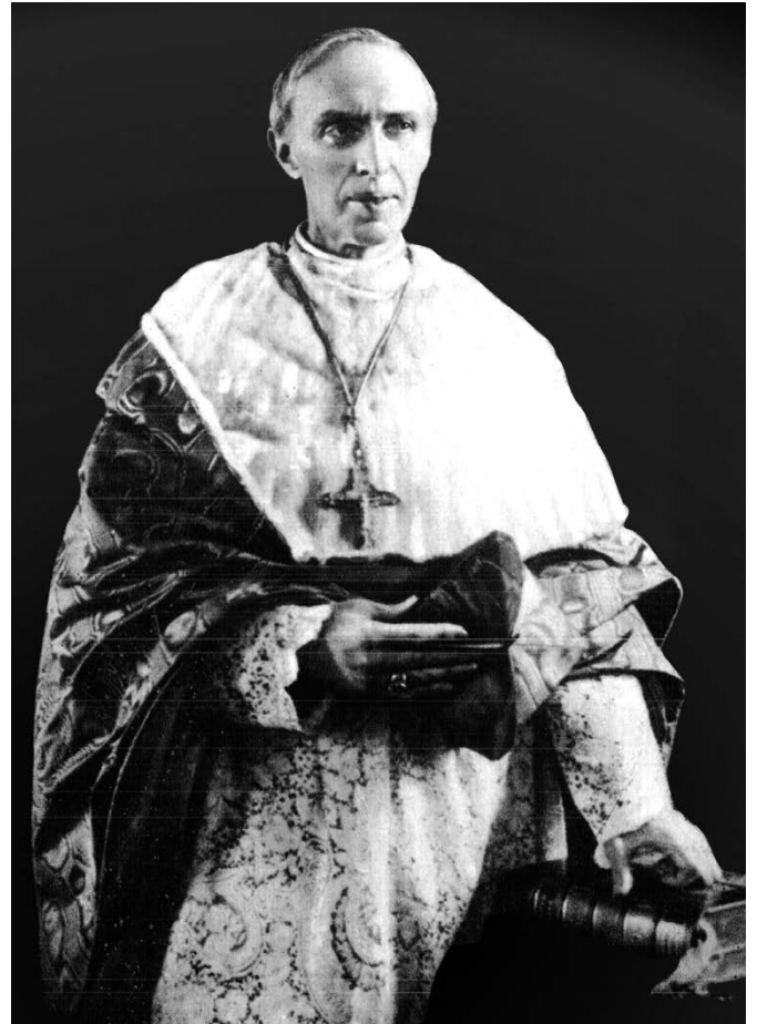
KARDINAAL DÉsirÉ MERCIER (1851-1926)

Rond Pasen vindt hij de tijd om, onder het pseudoniem Filodeem (“volksvriend”), een verhandeling