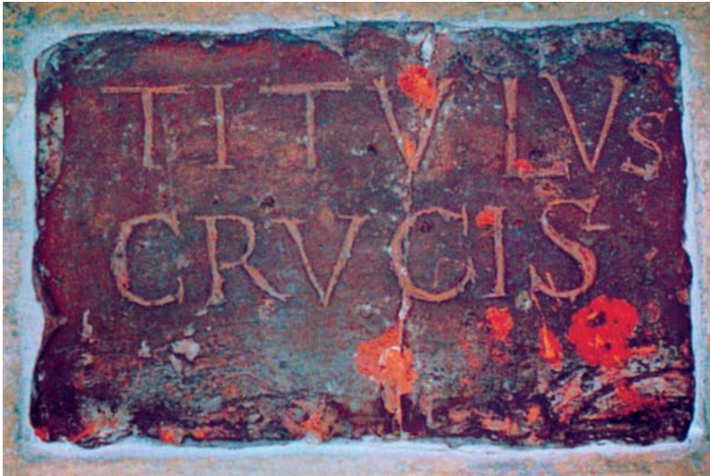
De sluitsteen met de vermelding TITVLVS CRVCIS, waarachter de relikwie tussen 1140 en 1492 verborgen bleef in een muur van de H. Kruiskerk.

In dat unieke document beschrijft Egeria een ritueel dat ze meemaakte in de kerk van het H. Graf in Jeruzalem in het jaar 383 :