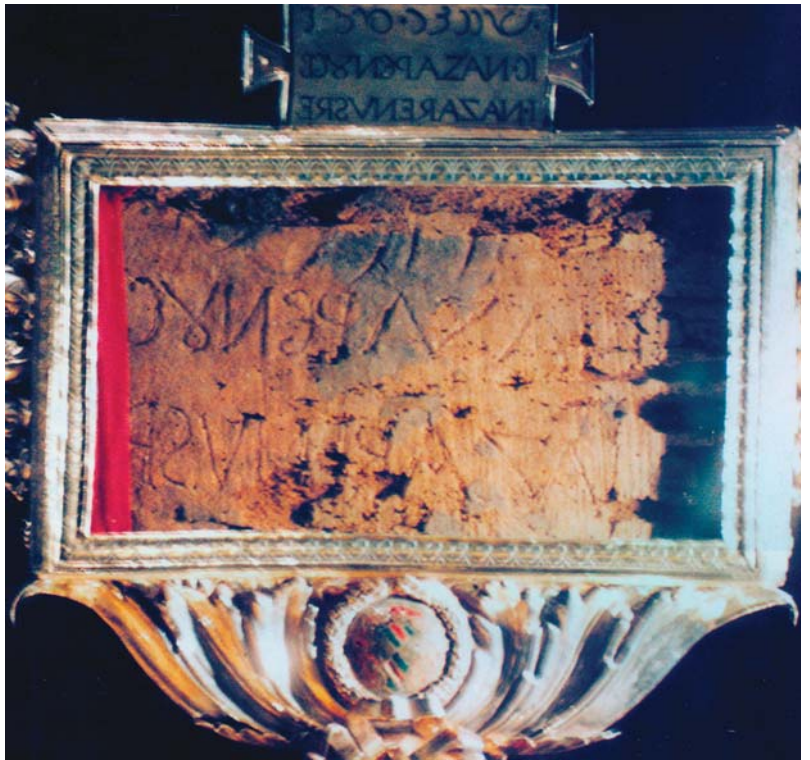
De relikhouder met wat er rest van het drietalig houten bordje boven het Kruis, de zgn. Titulus Crucis, die bewaard wordt in de basiliek van Santa Croce in Gerusalemme te Rome. Men herkent bovenaan de restanten van Hebreeuwse letters, in het midden Grieks schrift en onderaan Romeinse kapitalen.

« Op de vraag van Kaïphas: “Zijt gij de Christus, de Zoon van de Gezegende?”, antwoordt Jezus: “ Ik ben. Gij zult de Mensenzoon gezeten zien aan de rechterhand der Majesteit en Hem zien komen op de wolken des hemels ” (Mc 14, 61-62). Jezus verwijst hier uitdrukkelijk naar het visioen van de profeet Daniël, die schrijft: “En zie, met de wolken des hemels kwam iemand als een mensenzoon. Hij trad tot voor de Hoogbejaarde [de Vader] en werd vóór Hem geleid. Hem werd de heerschappij gegeven,