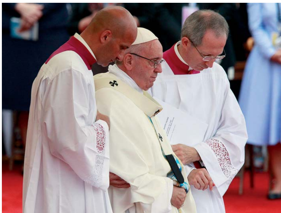
Paus Franciscus tijdens de H. Mis die hij op 28 juli 2016 opdroeg in Czeszochowa, Polen. Meer dan ooit is hij de « wankelende » paus uit het Derde Geheim van Fatima : woorden en daden van diep geloof wisselen af met bevreemdende toegevingen aan de geest van zijn twee voorgangers en het Concilie.

Anderhalve maand later, op 20 september, begaf de paus zich opnieuw naar Assisi, maar dat bezoek was in niets vergelijkbaar met de echt katholieke bedevaart van augustus. Franciscus ging er naar toe om de hersenschim van Joannes-Paulus II opnieuw op te roepen : een dag van gebed voor de wereld-