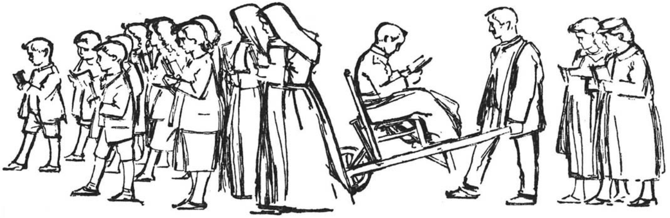
Op stap naar de Schipperskapel voor een noveen om genezing te bekomen !

De oplossing ligt voor de hand: de kerkelijke overheid moet het AKVS erkennen en de studentenbeweging moet doordrongen worden van de geest van de Eucharistische Kruistocht.