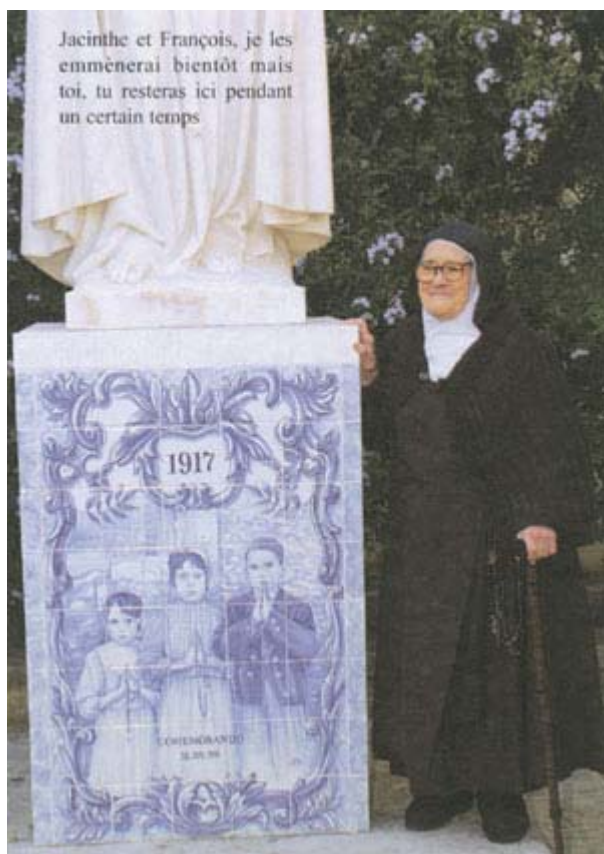
« Ik vraag u, hemelse Moeder, om mijn pen te willen vasthouden zodat ik trouw de Boodschap mag overbrengen die God mij langs U om heeft willen toevertrouwen. »

Hoe ernstig en aanstootgevend deze tegenstand van de kerkelijke overheid ook is, het is geen reden voor een schisma. Zich afscheuren van de Kerk komt neer op het toevoegen van