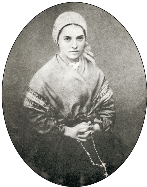
H. Bernadette Soubirous Lourdes 1844 - Nevers 1879